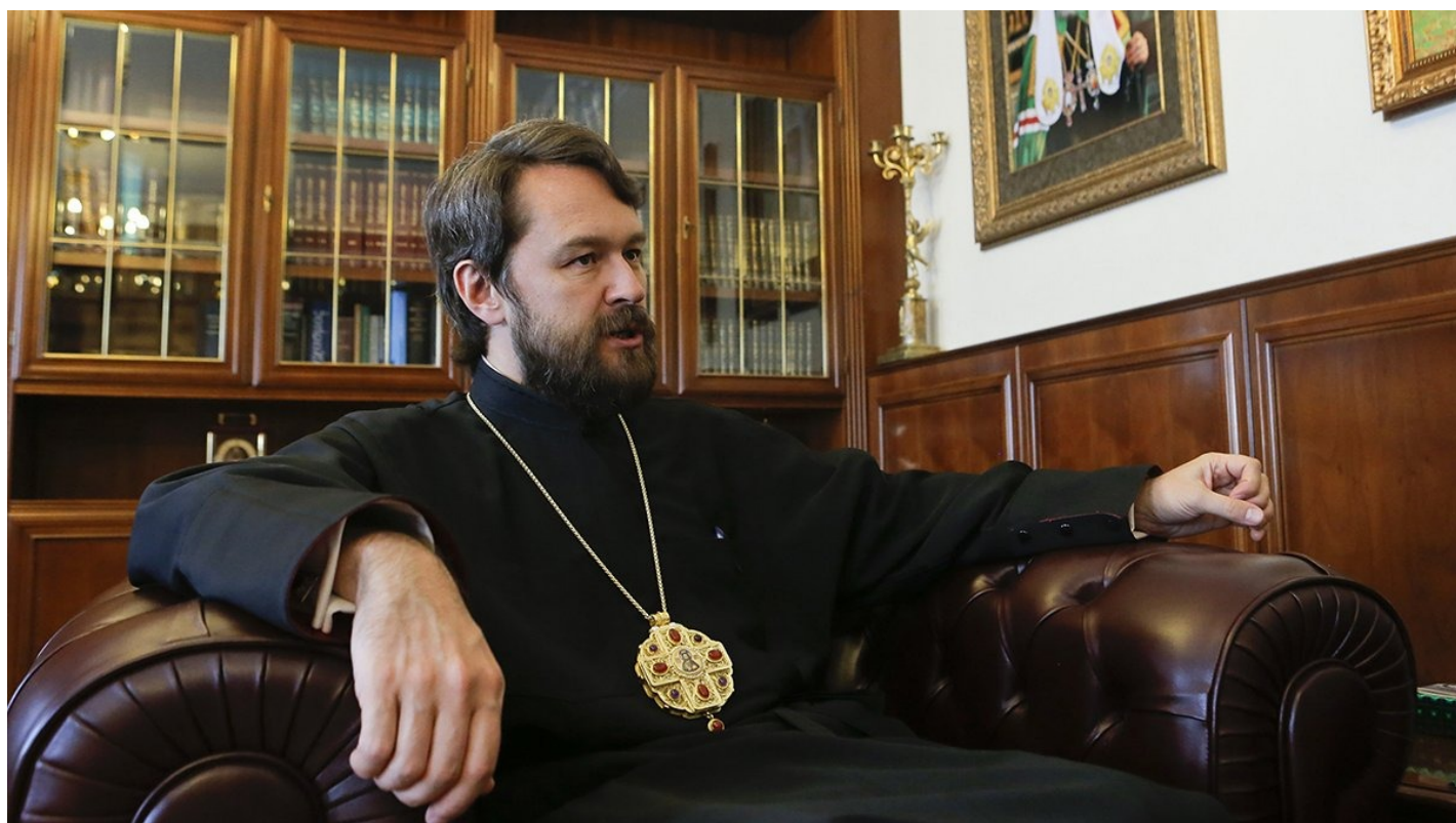
Митрополит Иларион дает интервью агентству Reuters в Москве, 16 мая 2014 года.

Бывший фаворит патриарха Кирилла получил венгерский паспорт, стал владельцем зарубежного поместья, вступил в сложные отношения со своим келейником и угрожал ему в проповедях и переписке