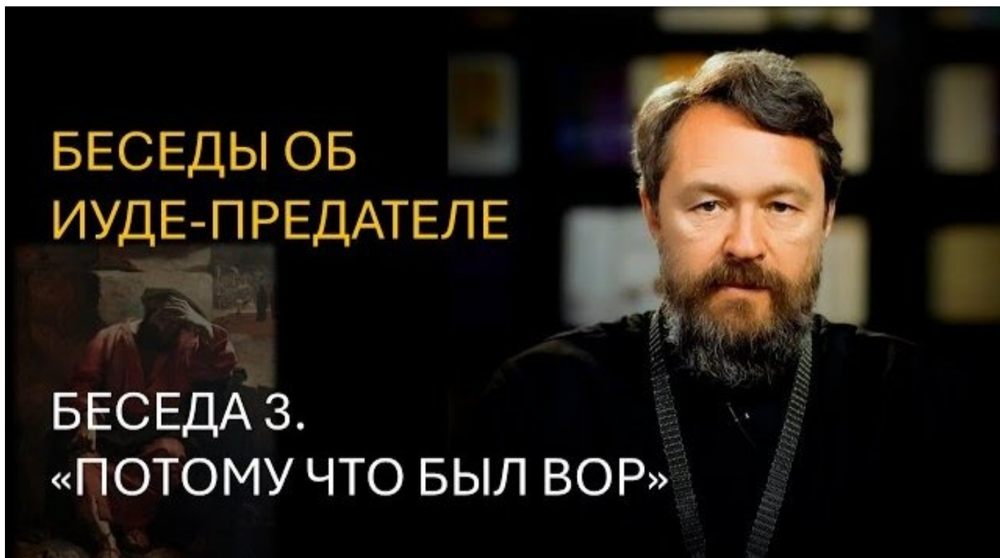
Обложка видео, опубликованного на YouTube-канале Илариона

В видео звучит фраза «если Иуда начал воровать, значит, в его жизни появилась иная ценность помимо учителя».