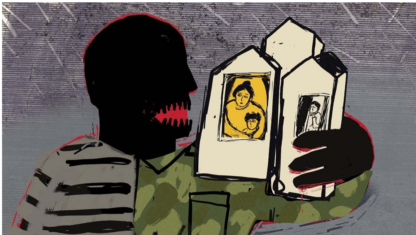
Иллюстрация: Алиса Красникова / «Новая газета Европа»

Война предлагает преступникам быстрый механизм освобождения: контракт — служба — возвращение свободным человеком. История Анны Кошулько, убийца которой отсидел всего полтора года