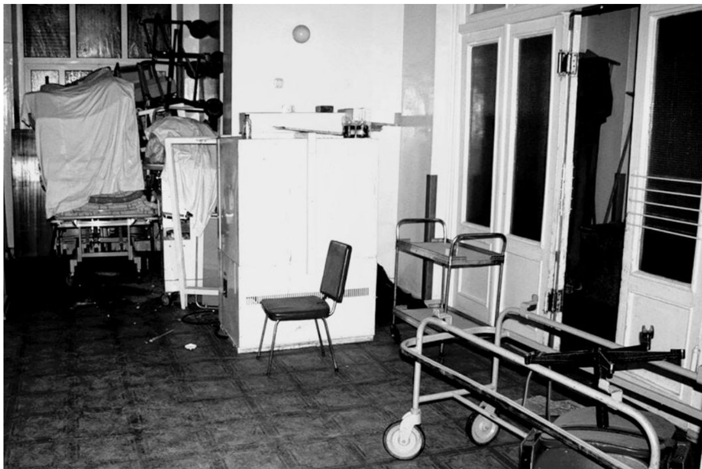
Кабинет медсестер и санитарок.

Саму Ирину как «одинокую» хоронить не стали: могила стоит дорого, так что туберкулезников без семьи в диспансере кремируют.