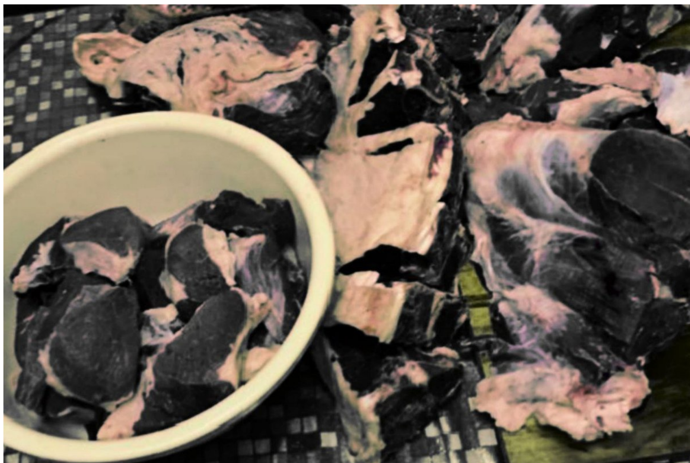
В диспансер привезли мясо на месяц.

Один раз в месяц в больницу привозят тушку говядины. Медсестры и санитарки разделяют мясо, отгоняя мух. Говядину добавляют во все блюда, потому что если не съесть ее в течение трех недель, то из-за плохого качества заморозки в холодильнике мясо испортится. Если оно портится, то в еду добавляют больше молотого черного перца «Красная цена» и все равно подают к столу. Но факт про перец мне рассказали по секрету.