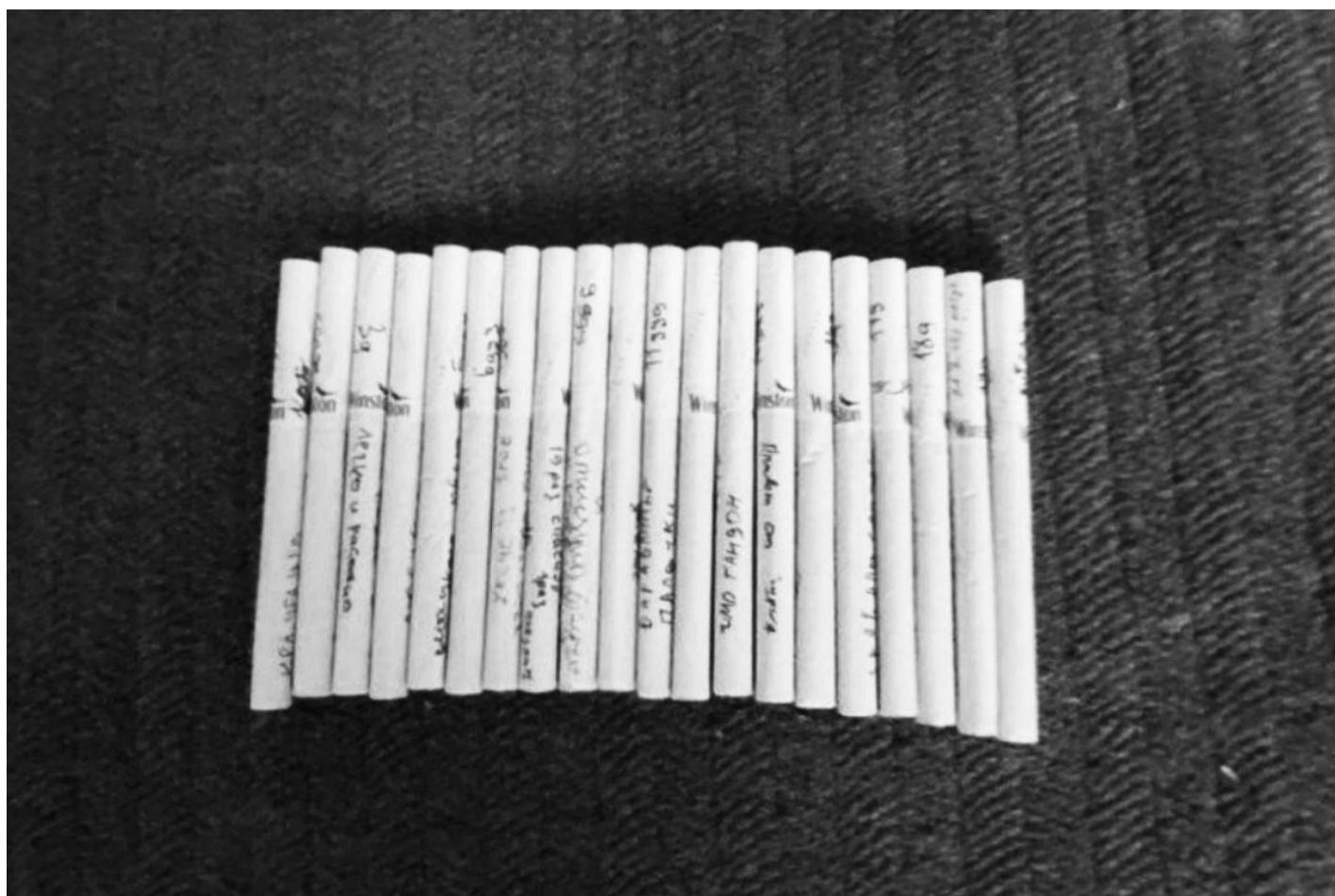
Подписанные сигареты.

На каждом этаже одна уборная, и на мужскую и женскую она не разделена. Этот участок диспансера напоминает клуб знакомств: в закутке у туалета постоянно кто-нибудь обнимается и хохочет, и, как мне рассказала медсестра, не всегда люди разного пола. Я нашла пару, планирующую свадьбу, «если выживут». Но для начала развод — с супругами, оставшимися на свободе. Они отказались говорить под запись из-за страха, что о романе узнают их семьи.