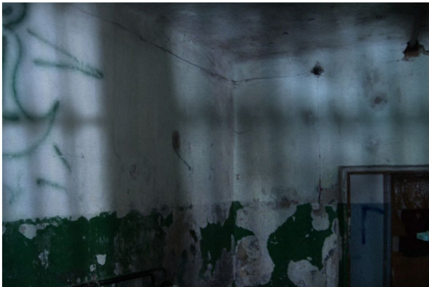
Стены палаты в отделении открытой формы туберкулеза.

— Была вот месяца два назад одна девушка. Часто видел ее, красивая была, мне нравилась. В один день в общей комнате смотрели вечером телек, видел, как она играла в настолки с другими пациентами. Ей не повезло, не выдержала печень: таблетки, которые тут дают, сильно нагружают и ее, и вообще все органы. На следующий день увезли в мешке, — вспоминает Ваня.