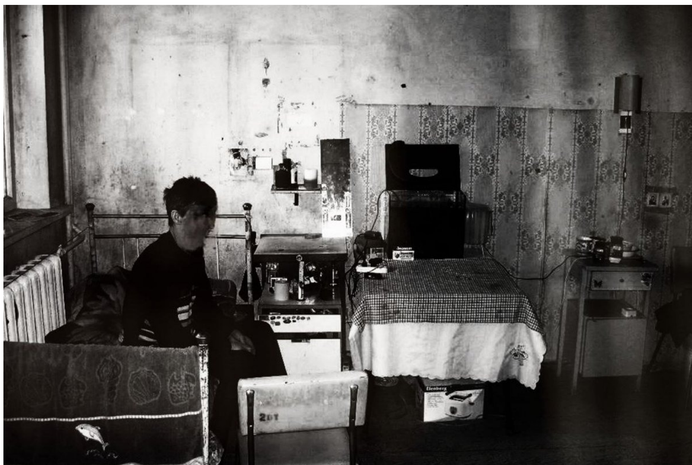
Палата «блатных», самая оснащенная в диспансере.

Они лежат и обсуждают, кто из их отделения умрет первым. Федя считает, что «толстая женщина» с диабетом, потому что диабетики с туберкулезом долго не живут. Иван ставит на «шкета» — молодого худого паренька 32 лет, который весит 43 килограмма. Ваня уверен, что «дрыщ и нарик» умрет раньше всех, потому что в последнюю неделю стремительно теряет в весе и становится «сине-зеленым». Мужики долго думали, на что будут спорить, — денег у обоих нет и не предвидится, поэтому поспорили на старшую медсестру с рыжими волосами. Точнее, за приоритетное право за ней ухаживать.