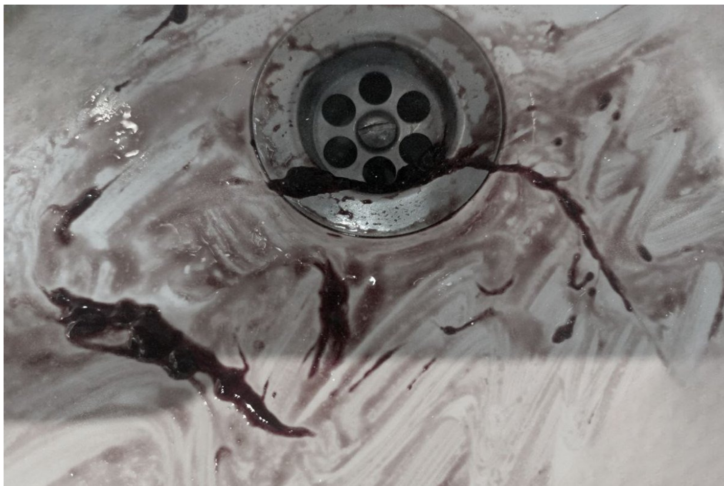
Кровяная слизь пациентов в раковине после кашля.

Поговорка «стены все слышат» из-за тонких стен здесь воспринимается буквально: даже из отделения с туберкулезниками закрытого типа слышно, как харкают и выплевывают кровь пациенты в отделении с открытой формой болезни.