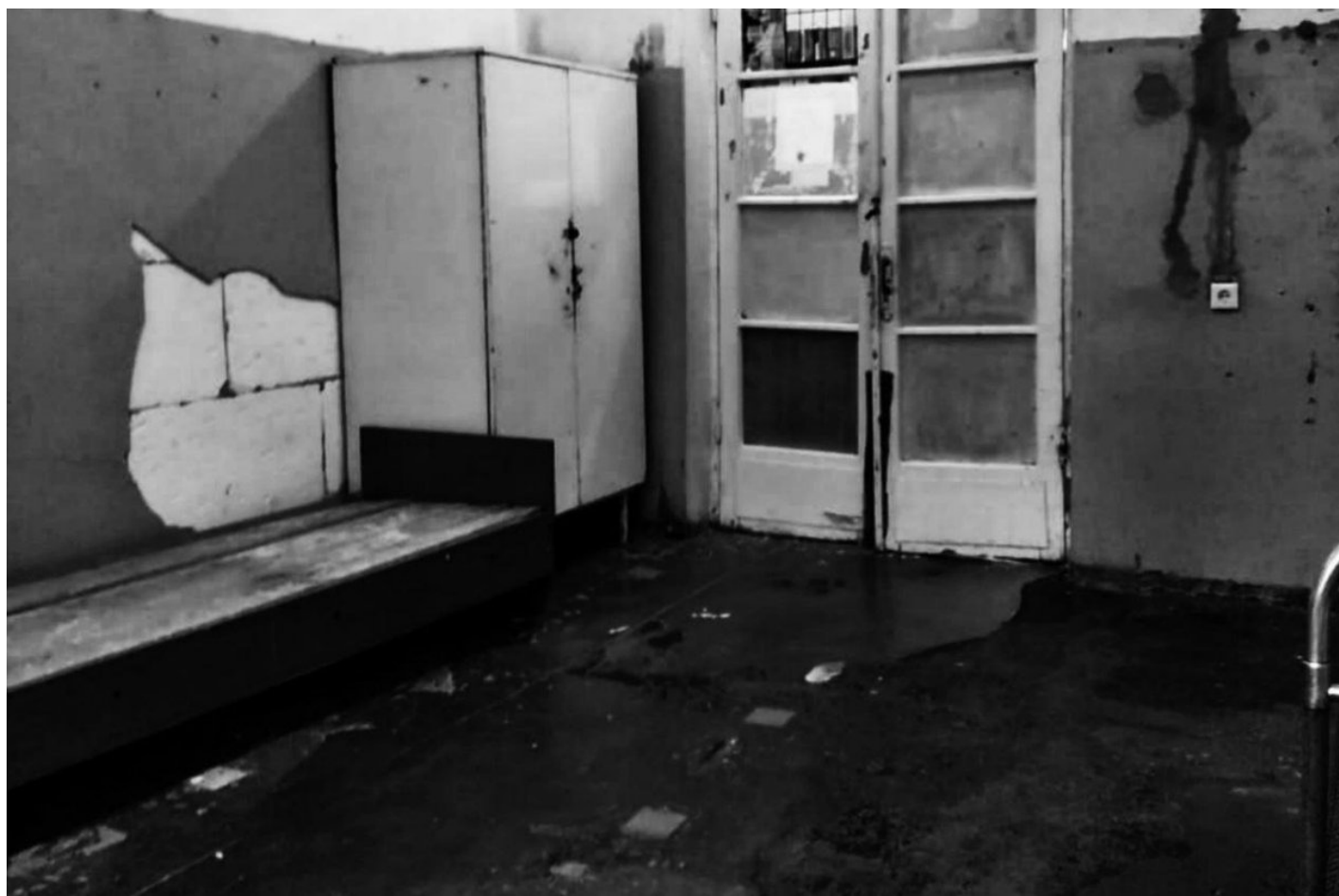
Палата в отделении закрытой формы туберкулеза.

От инфицирования до появления признаков заболевания может пройти от нескольких месяцев до нескольких лет. Огромное значение имеет состояние защитных сил организма, в первую очередь иммунной системы.