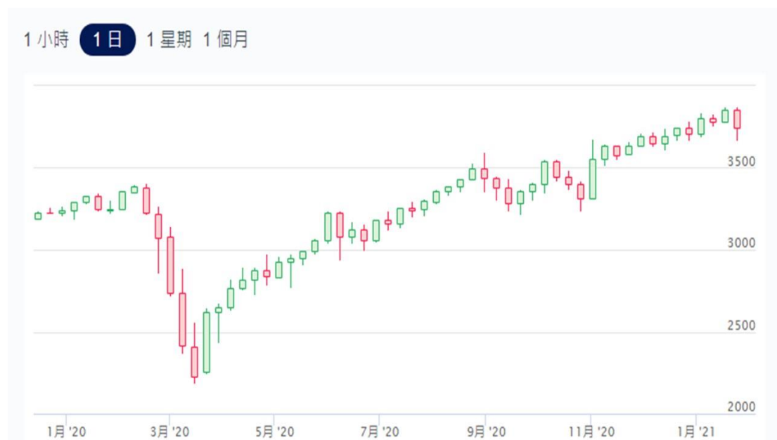
S&P 500 日線走勢圖 (截至 2021/1/31)