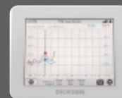
Data logger Touchscreen

Personaliza el sistema de supervisión de tu refrigerador eligiendo uno o más de los dispositivos disponibles: