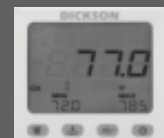
Data logger DSB con descarga de datos en dispositivo USB

Puerta con doble panel de vidrio termoestable con gas argón entre sus paneles, con auto cierre.