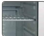
Puerta con doble panel de vidrio termoestable con gas argón entre sus paneles, con auto cierre.