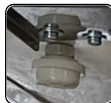
Cuatro patas con base aislante

Los refrigeradores/congeladores para laboratorio y farmacia están diseñados para tener un correcto almacenamiento y preservación de productos farmacéuticos, medicamentos y reactivos. Asegurando que el producto se almacena en las mejores condiciones sanitarias y de temperatura, con un esbelto sistema de supervisión de alarmas y graficador de temperatura o Data loggers de temperatura.