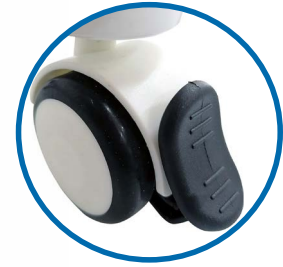
Ruedas con frenos