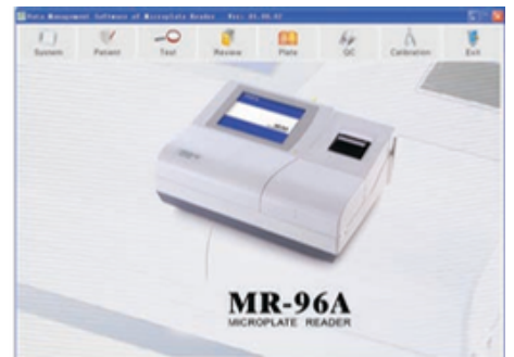
Data Management Software