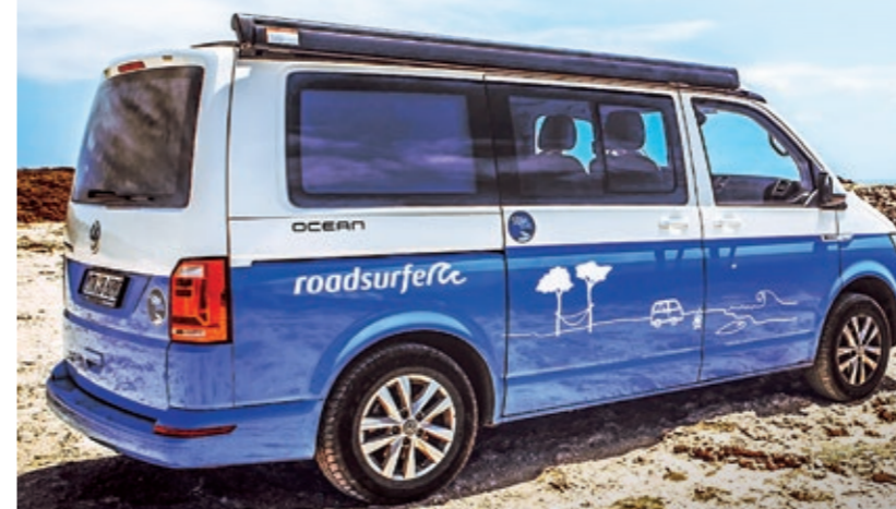
◀ Aktuell im Angebot sind Fahrzeuge der Anbieter Roadsurfer und Indie Campers