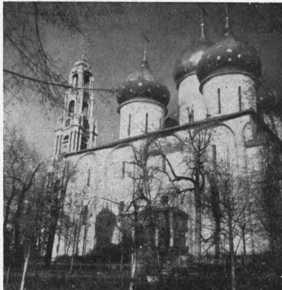
Eén der kerken van het klooster-complex te Zagorsk

De koorzangen zijn monotoner, doch zeer klankvol. Ze klonken prachtig door de onoverzichtelijke ruimten.