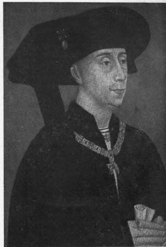
Rogier van der Weyden (1399—1464)