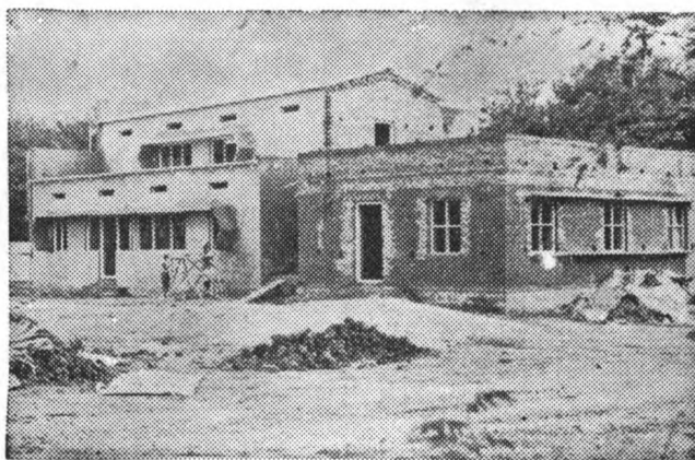
Hier ziet U een foto van het weeshuis, toen het nog in aanbouw was.