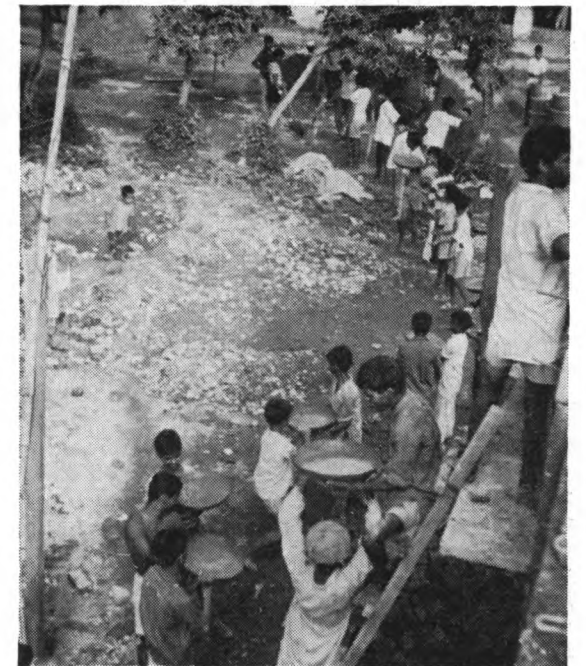
The Children's Home