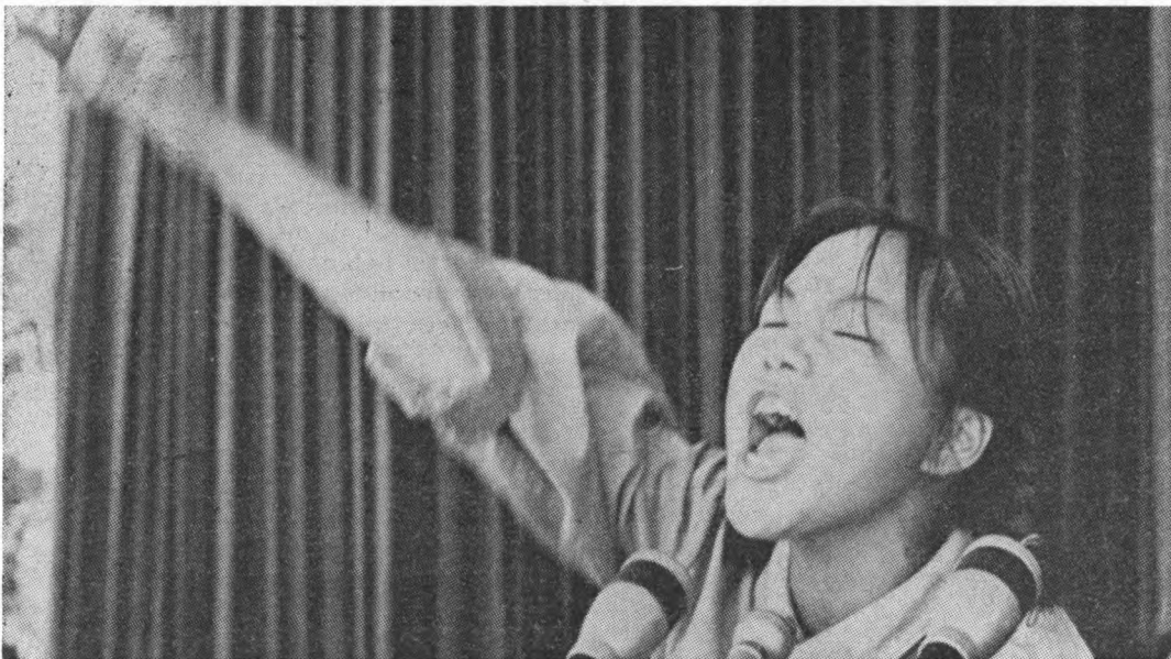
Rode Garde in China