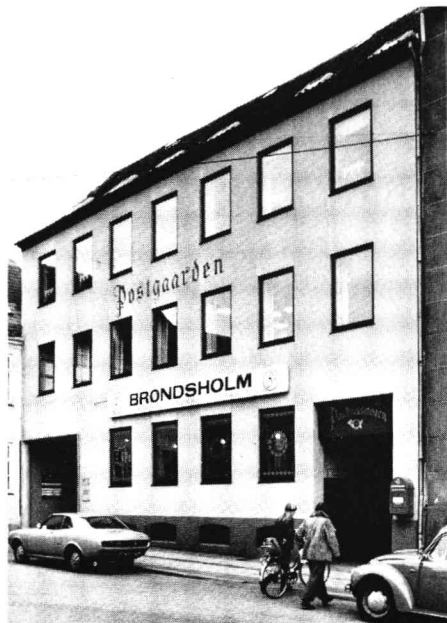
Fredens Torv nr. 8. »Postgården«