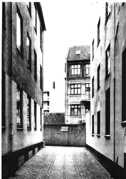
Fredens Torv nr. 8. Posthussmøgen