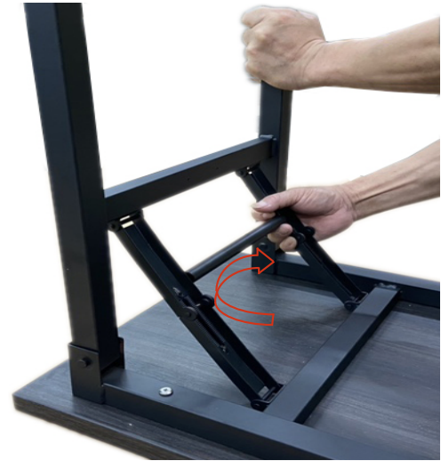
Lock legs Verrouillage des pattes Fije las patas

Para bloquear las patas, con el tablero de mesa orientado hacia abajo, tire con fuerza hacia arriba el mecanismo de bloqueo lateral hasta que escuche o sienta que se ha fijado a presión. Vea la foto abajo, repita el procedimiento al otro lado.