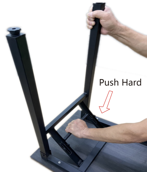
Fold the legs Repliement des pattes Pliegue las patas

Precaución: No ponga los dedos en el área del mecanismo de bloqueo.