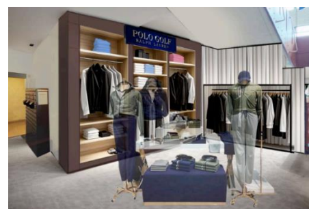
大分県内初出店 ラルフローレンプロショップ