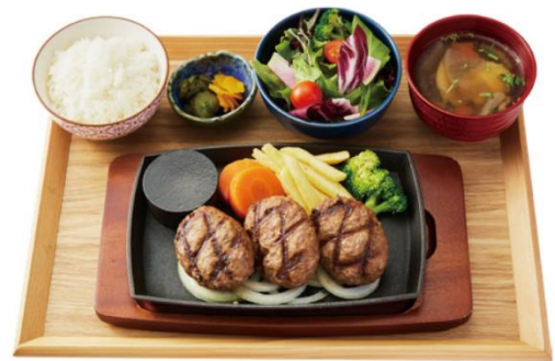
手づくり ジューシーハンバーグ定食（80g×3個） ¥1,650（税入）