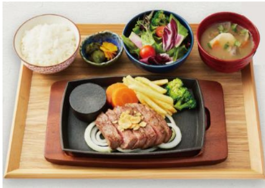
豊後牛 ロースステーキセット ¥2,800（税入）