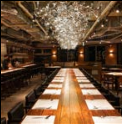
レストラン Tsubamesanjo Bit 燕三条本店

〒955-0092 新潟県三条市須頃1-17（燕三条地場産業振興センター1階） ランチ：11:30~15:00 (L.O 14:30) ディナー：18:00~23:00 (L.O 21:30) 電話：0256-46-0680