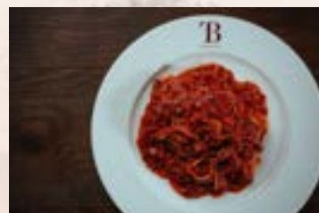
新潟和牛のボロネーゼスパゲティ