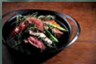
お肉の盛り合わせ