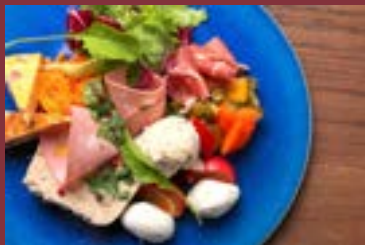
前菜の5種盛り合わせ