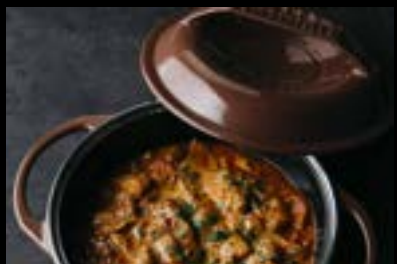
新潟精密铸造 新潟県燕市