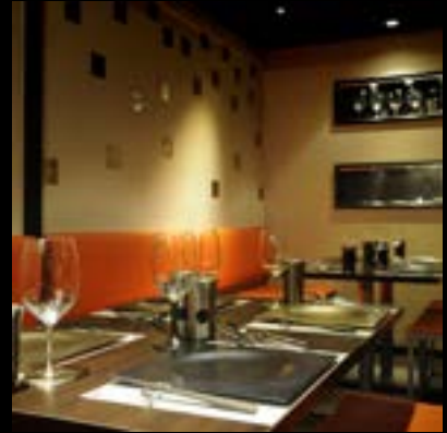
レストラン Tsubamesanjo Bit 銀座店

〒951-8051 新潟市中央区新島町通1ノ町1977 ランチ：11:30~15:00 (L.O 14:30) ディナー：18:00~23:00 (L.O 21:30) 電話：025-201-7933