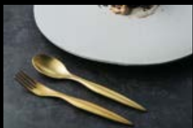
SATOMI SUZUKI TOKYO 新潟県三条市