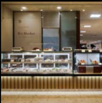
マーケット Bit Market 新潟伊勢丹店

〒100-0004 東京都千代田区大手町2丁目6-4 常盤橋タワー 1F 【月~金】 ランチ 11:00~14:30(L.O.14:00) ディナー 18:00~22:30 (L.O.21:30、ドリンクL.O.22:00) 【土・日・祝】 ランチ 11:00~15:00(L.O.14:30) ディナー 18:00~22:00 (L.O.21:00、ドリンクL.O.21:30) 電話：03-6262-3936