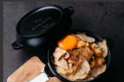
snow peak 新潟県三条市