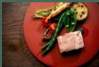
三条産下田豚の低温調理