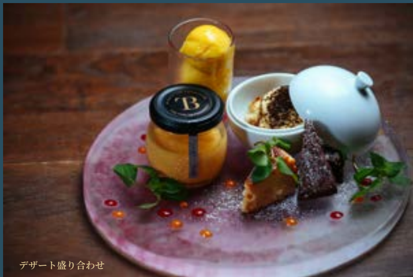
デザート盛り合わせ