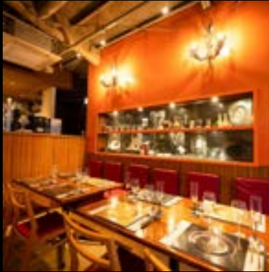
レストラン Tsubamesanjo Bit 新潟店

〒955-0092 新潟県三条市須頃1-17（燕三条地場産業振興センター1階） ランチ：11:30~15:00 (L.O 14:30) ディナー：18:00~23:00 (L.O 21:30) 電話：0256-46-0680