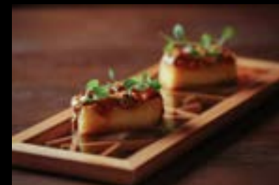
大湊文吉商店 新潟県加茂市