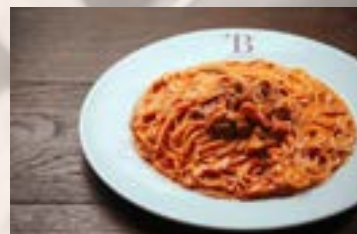
北海道産塩水ウニの トマトクリームスパゲティ