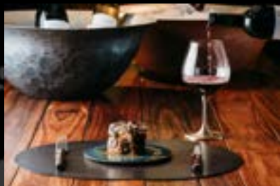
玉川堂 新潟県燕市