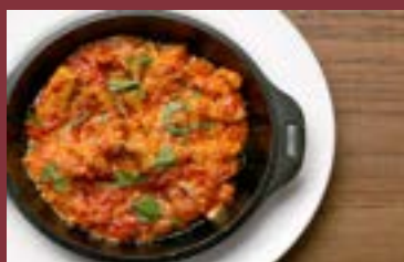
国産牛トリッパのトマト煮込み

雪室熟成じゃがいもの ポテトフライ トリュフ風味・・・・・・・・・・¥680(税込¥748)