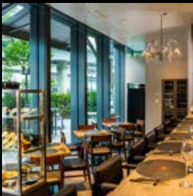
レストラン Tsubamesanjo Bit 東京店

〒104-0061 東京都中央区銀座7丁目8-8 isgビル3F ランチ：11:30~15:00 (L.O 14:00) ディナー：18:00~23:00 (L.O 22:00) 電話：03-6228-5636