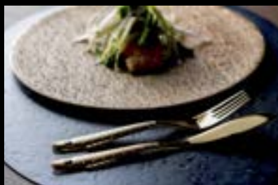
YAMAKIN 山崎金属工業株式会社 新潟県燕市