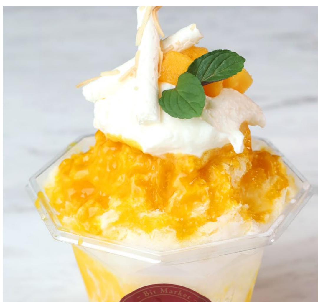
マンゴーとココナッツのかき氷