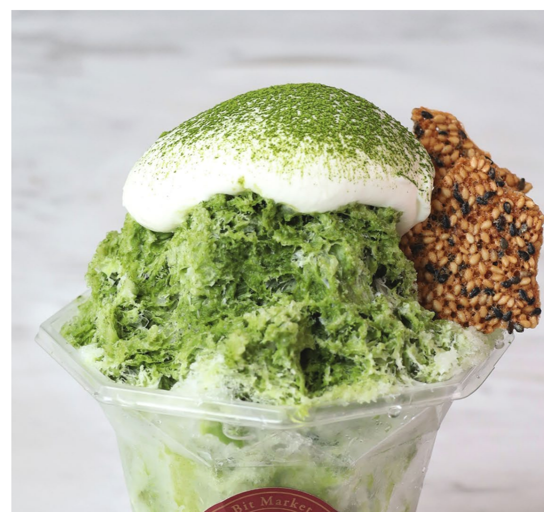
村上富士美園の抹茶かき氷