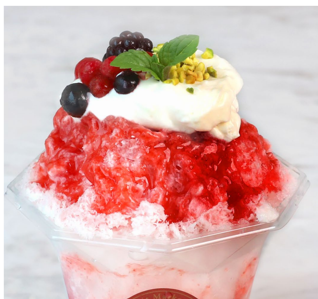
いちごとライチのかき氷