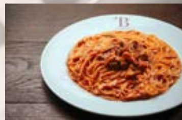
北海道産塩水ウニの トマトクリームスパゲティ