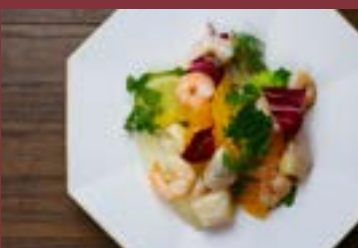
海老と帆立のイタリアンマリネ