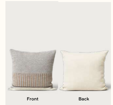
アイマラ スクエア クッション (Pattern Grey)

Material: カバー：アルパカウール 100% (無染色) インナー：再生PET ファイバー 50%, ダウン 50% Origin: ポリビア Product no: 3420 Details: 52 x 52cm Price: ¥20,000