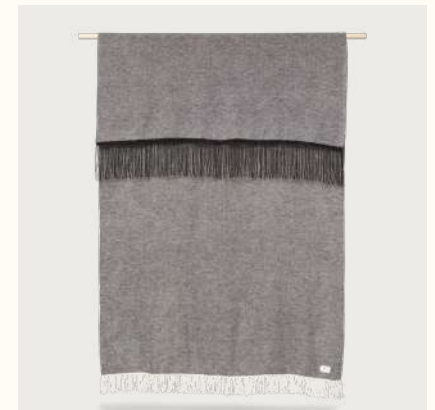
アイマラ プレイド (Moulinex)