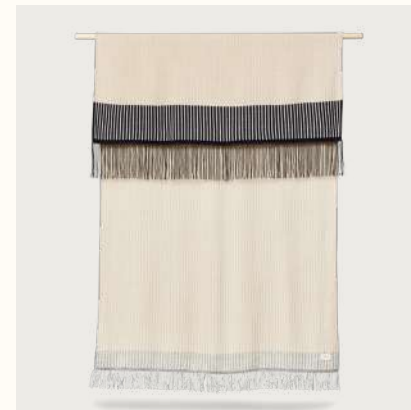
アイマラ プレイド (Pattern Stripes)