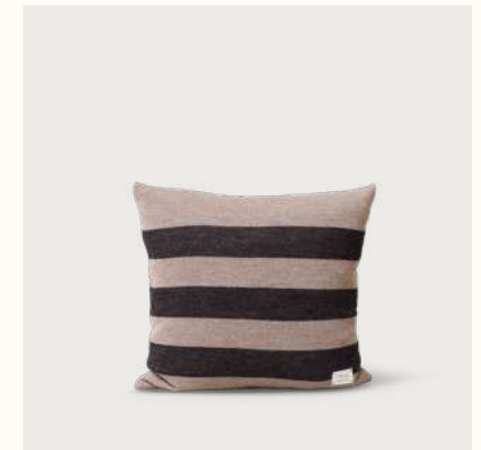
アイマラ スクエア クッション (Ribbon)

Material: カバー：アルパカウール 100% (無染色) インナー：再生PET ファイバー 50%, ダウン 50% Origin: ポリビア Product no: 3425 Details: 52 x 52cm Price: ¥20,000