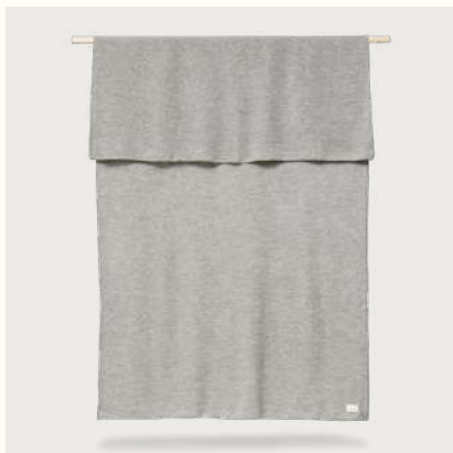
アイマラ ブレイド (Grey)