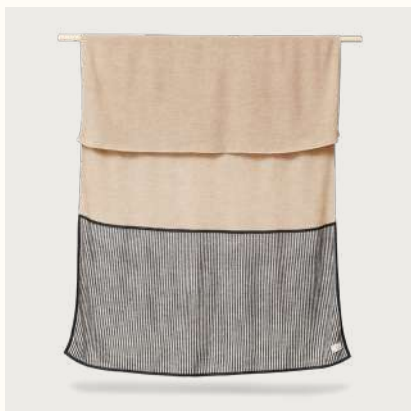
アイマラ ブレイド (Rib Light Brown)