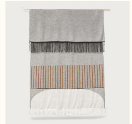
アイマラ プレイド (Pattern Grey)