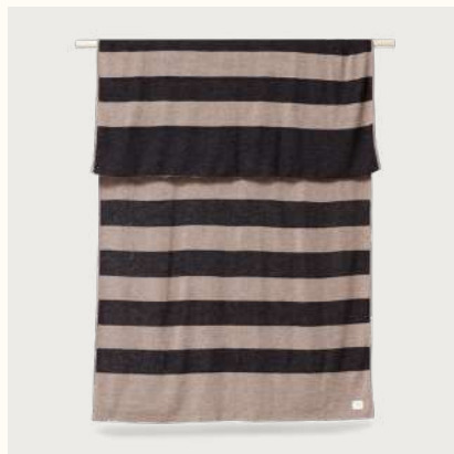
アイマラ ブレイド (Ribbon)