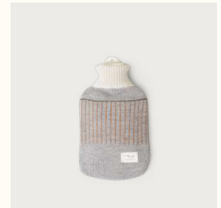
アイマラ ホットウォーターボトル (Grey)