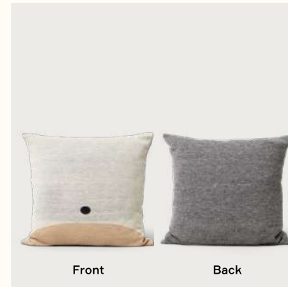
アイマラ スクエア クッション (Pattern Cream)

Material: カバー：アルパカウール 100% (無染色) インナー：再生PET ファイバー 50%, ダウン 50% Origin: ポリビア Product no: 3420 Details: 52 x 52cm Price: ¥20,000