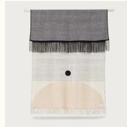
アイマラ プレイド (Pattern Cream)