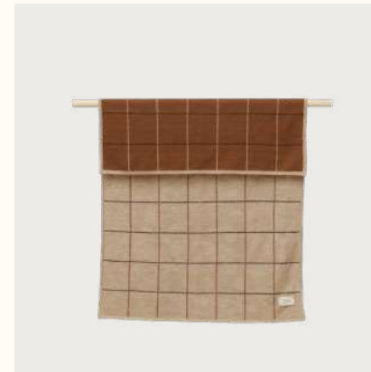
アイマラ キッズブレイド (New Squares)