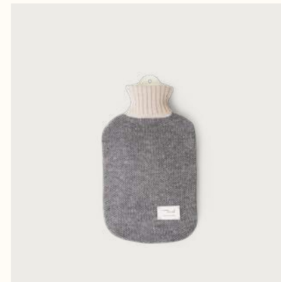
アイマラ ホットウォーターボトル (Pattern Cream)