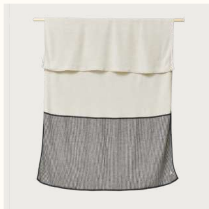
アイマラ ブレイド (Rib Cream)