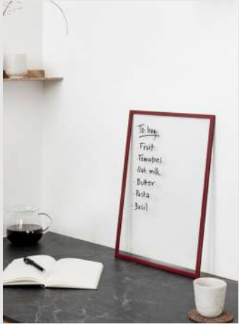
Frame | Page 4