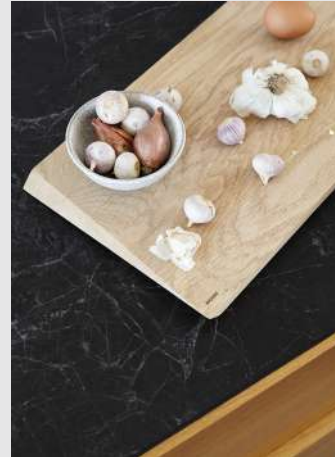
Cutting Board | Page 11