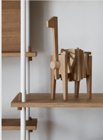
Polygrif | Page 10