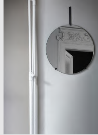
Wall Mirror | Page 7