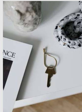
Key Ring | Page 9