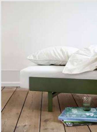
Bed | Page 13