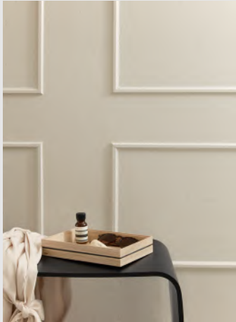
Organise | Page 10