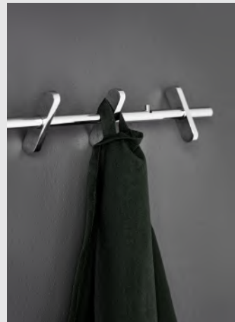
Coat Rack | Page 9