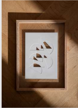
Papercut Artworks | Page 6