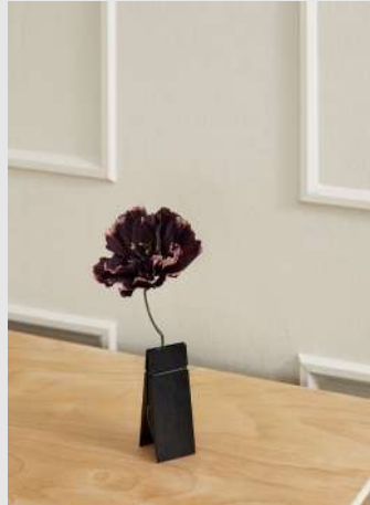
Pinch | Page 11