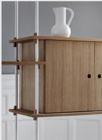
Shelving System | Page 15