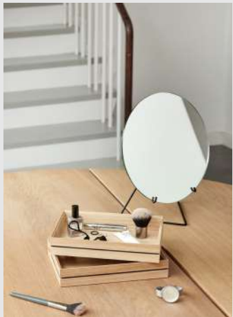
Standing Mirror | Page 8