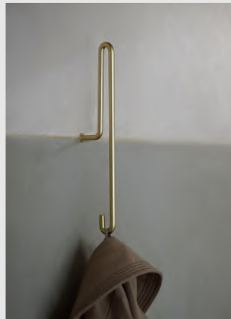
Wall Hook | Page 9