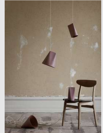
Ceramic Pendant | Page 11