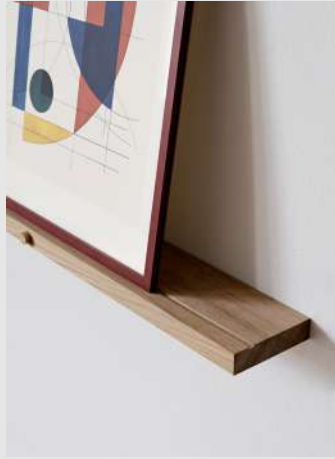
Gallery Shelf | Page 6