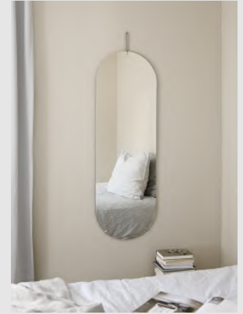
Tall Wall Mirror | Page 8