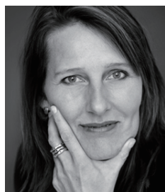
マリア・バートセン

デンマーク王立デザイン学校と仏ポルドー建築学校で学んだ後、1992年に自身のスタジオを設立、ジョージ ジェンセン、ティファールなど国際的ブランドで活躍している。代表作のホルムガード「Design with Light」をはじめ、空間のムードを作り出す灯りのデザインに定評がある。