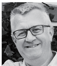
クラウス・ダルビー

ガーデニングに情熱を注ぎ、花に関する芸術活動や執筆、出版までに及ぶ。ホルムガードとの共同開発による「Old English」シリーズでは、ガラスと伝統的な英国式庭園の融合を実現した。