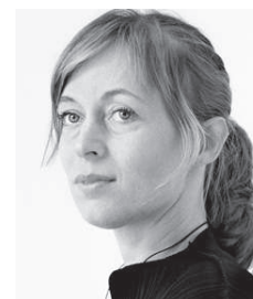
セシリエ・マンツ

フィンランドで芸術とデザインを学び、デンマーク王立デザイン学校を卒業。N.Y. 近代美術館 MoMA に作品が展示されるなど、世界的に活躍する現代のデザイン界を代表する一人。ホルムガード「MINIMA」シリーズはデンマークデザインアワード受賞。