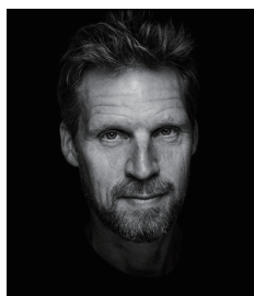
セバスチャン・ホルムバック

プロダクトデザイン、家具、照明、展示会、インテリアデザインなど幅広い分野で活躍しているデンマークのインダストリアルデザイナー。国際的にも著名なブランドと長期的な関係を築き、文化的な影響力を持つ製品をデザインしている。