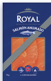
ROYAL® SALMÓN AHUMADO 75 G