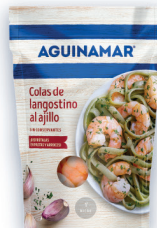
AGUINAMAR® COLAS DE LANGOSTINO AL AJILLO 105 G