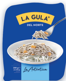
LA GULA® DEL NORTE BANDEJA DE 200 G