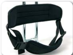
P2 - Rugsteun