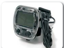
E3 - Kilometer teller (batterijen inbegrepen)