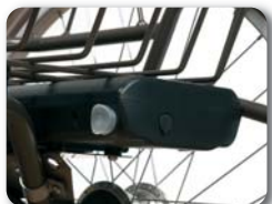
BAT 9 - BAT 13 - Extra batterij E-bike (9A of 13A)