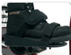
F3 - Pedaal voetplaat met Velcro