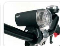
E2 - Verlichtingskit (batterijen inbegrepen)