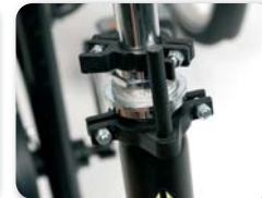
D1 - Stuurrichting begrenzer