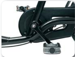
O1 + B1 - Vrijloop