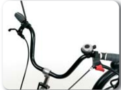
S1 - Klassiek stuur