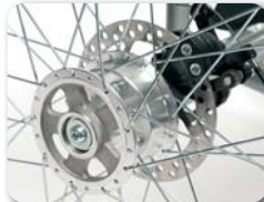
B1 - Remschijf achterwiel