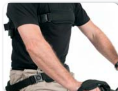
P3 - Heup en rugsteun