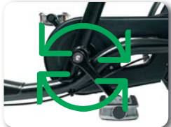
O6 - Vast tandwiel