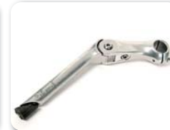
S5 - Regelbare stuurstang (-10° tot +50°)