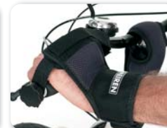
E10 - Hand en polsfixatie met Velcro