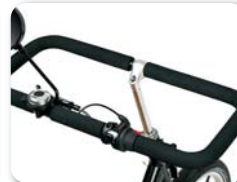
S4 - Rechthoekig stuur