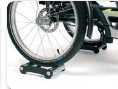
E13 - Hometrainer