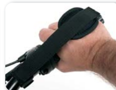
E9 - Handfixatie met Velcro