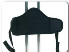
P1 - Heupsteun