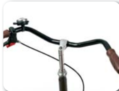
S3 - "City" stuur