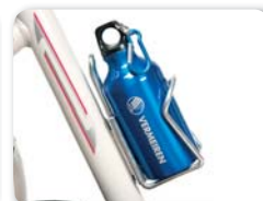
E7 - Bekerhouder (beker niet inbegrepen)