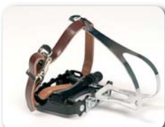
F2 - Pedaal met voethaak