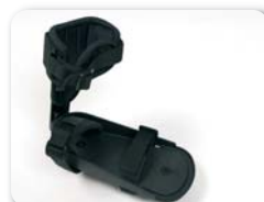
F4 - Pedaal voetplaat met beenklem en Velcro