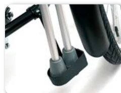
E6 - Krukkenhouder