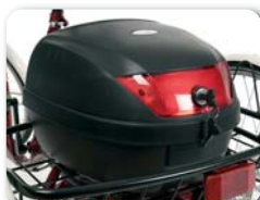
E5 - Topcase met slot volume: 30 liter