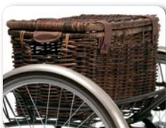
E4 - Vintage mand