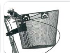
E14 - Inkoopmand