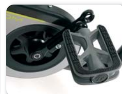
F5 - Trapstang regelbaar in lengte (22 mm)