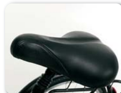
E12 - Comfort zadel PU + plastic