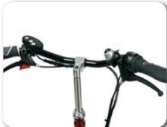
S2 - Plat stuur