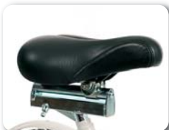
P4 - Zadel verstelbaar in diepte (140 mm)