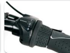
O3 - 3 versnellingen O7 - 7 versnellingen