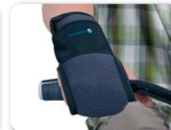
E11 - Gesloten handfixatie met Velcro