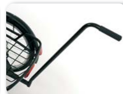
E1 - Duwstang (335 mm of 605 mm)