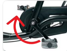
O2 - Terugtraprem