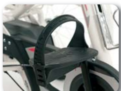
F1 - Pedaal met voetriem