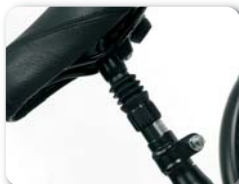
P5 - Zadelbuis met vering