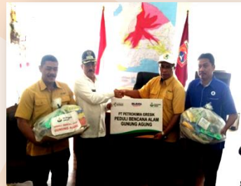
Bantuan Gn Agung

Beasiswa Petro S1 (78org) dan SMA (147org) Program LOLAPIL Link&Match SMK-Industri Beasiswa anak asuh&prestasi Jambore Kebangsaan & Kewirausahaan Pelatihan Service AC Kartar BUMN Hadir Untuk Negeri