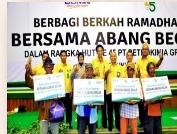
Berbagi dg Abang Becak