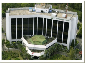
KANTOR PUSAT PETROKIMIA GRESIK

Telp. : 031 3982200, Fax. : 031 398 8863 Dep. Penjualan Pupuk Korporasi. Ext. 2253, 2913