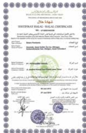
Sertifikat Halal Jenis Produk Bahan Pembantu Halal Certificate Assistant Materials Product Type