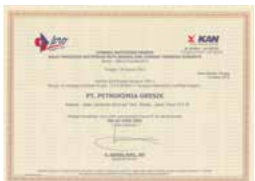
Sertifikasi Produk Tipe 5 - Pupuk SP-36 Product Certification Type 5 - SP-36 Fertilizer