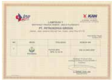
Sertifikasi Produk Tipe 5 Pupuk NPK Padat - Lampiran 1 Product Certification Type 5 Solid NPK Fertilizer - Attachment 1