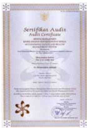
Sertifikat Audit Audit Certificate