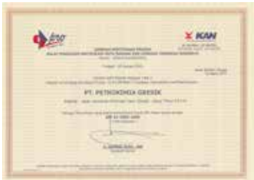
Sertifikasi Produk Tipe 5 Pupuk NPK Padat Product Certification Type 5 Solid NPK Fertilizer