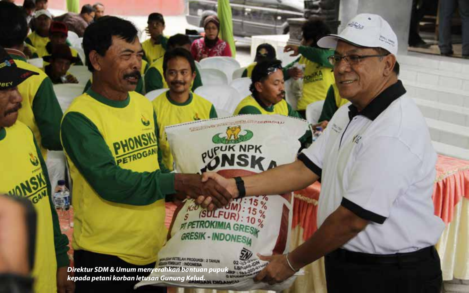
Direktur SDM & Umum menyerahkan bantuan pupuk kepada petani korban letusan Gunung Kelud.