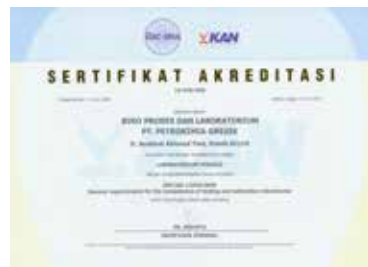
Sertifikat Akreditasi Kompetensi sebagai Laboratorium Pengujian Certificate of Competency as a Testing Laboratory Accreditation