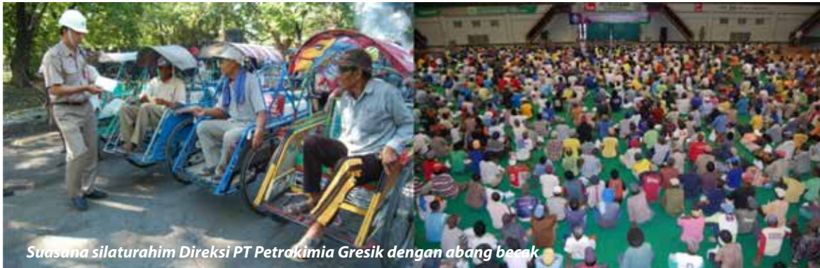
Suasana silaturahmi Direksi PT Petrokimia Gresik dengan abang becak