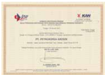
Sertifikasi Produk Tipe 5 - Pupuk ZA Product Certification Type 5 - ZA Fertilizer