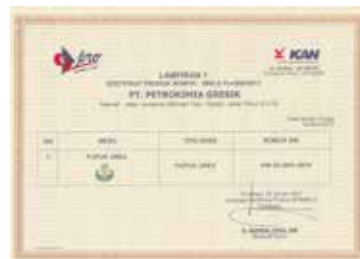
Sertifikasi Produk Tipe 5 - Pupuk Urea - Lampiran 1 Product Certification Type 5 - Urea Fertilizer - Attachment 1