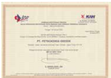
Sertifikasi Produk Tipe 5 - Pupuk Urea Product Certification Type 5 - Urea Fertilizer