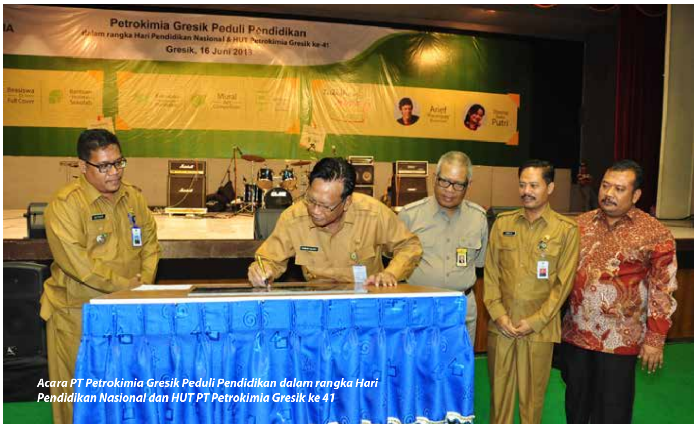
Acara PT Petrokimia Gresik Peduli Pendidikan dalam rangka Hari Pendidikan Nasional dan HUT PT Petrokimia Gresik ke 41

Teknik Elektro 1), Unair sebanyak 1 orang (Ekonomi Pembangunan), dan ITB sebanyak 1 orang (FMIPA) hasil penerimaan tahun 2012. Program beasiswa ini sebagai kelanjutan proses seleksi tahun 2012 yang menetapkan sejumlah 6 (enam) siswa tidak mampu dari Gresik yang diterima di perguruan tinggi negeri tahun akademik 2012 sebagai penerima beasiswa penuh (full cover) sampai dengan lulus/maksimal 4 tahun (8 semester) terhitung sejak tanggal 1 Agustus 2012 sampai dengan 31 Juli 2016. Keenam mahasiswa menerima beasiswa berupa bantuan at cost yang meliputi biaya masuk kuliah, biaya semester & biaya penelitian, tugas akhir/skripsi serta biaya hidup bulanan Rp 1.750.000,-/mahasiswa.