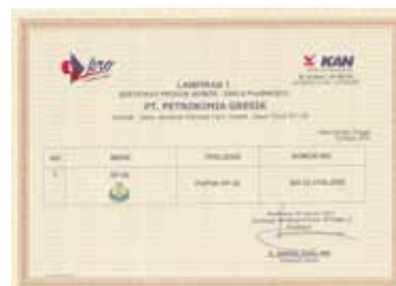
Sertifikasi Produk Tipe 5 - Pupuk SP-36 - Lampiran 1 Product Certification Type 5 - SP-36 Fertilizer - Attachment 1