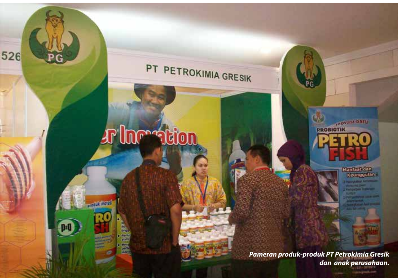
Pameran produk-produk PT Petrokimia Gresik dan anak perusahaan.

Pelaksanaan PKBL diaudit setiap tahun oleh akuntan publik, dan menjadi salah satu kriteria yang mempengaruhi kinerja Perseroan yang bernaung di lingkungan Kementerian BUMN. Melalui program-program PKBL ini diharapkan akan mendorong pertumbuhan ekonomi, mengurangi angka kemiskinan, membantu pendidikan serta membangun masyarakat yang bertakwa kepada Tuhan Yang Maha Esa.