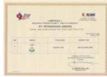
Sertifikasi Produk Tipe 5 - Pupuk DAP - Lampiran 1 Product Certification Type 5 - DAP Fertilizer - Attachment 1