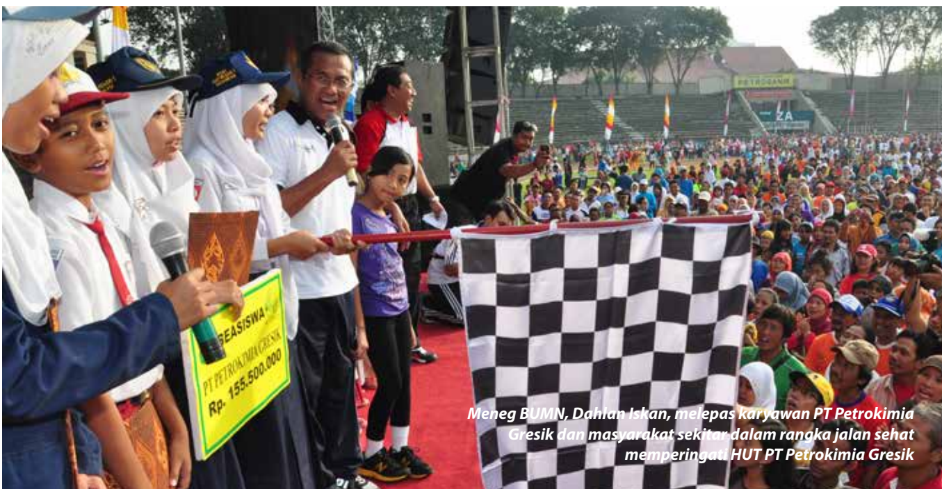
Meneg BUMN, Dahlan Iskan, melepas karyawan PT Petrokimia Gresik dan masyarakat sekitar dalam rangka jalan sehat memperingati HUT PT Petrokimia Gresik

dengan menciptakan lingkungan tempat kerja aman dan nyaman, memastikan dan memperbaiki Kesehatan, Keselamatan dan Keamanan (K3) karyawan. Manajemen K3 ini telah menjadi budaya perusahaan. Oleh karenanya seluruh karyawan ikut terlibat dalam menciptakan kondisi kerja yang aman dan nyaman.