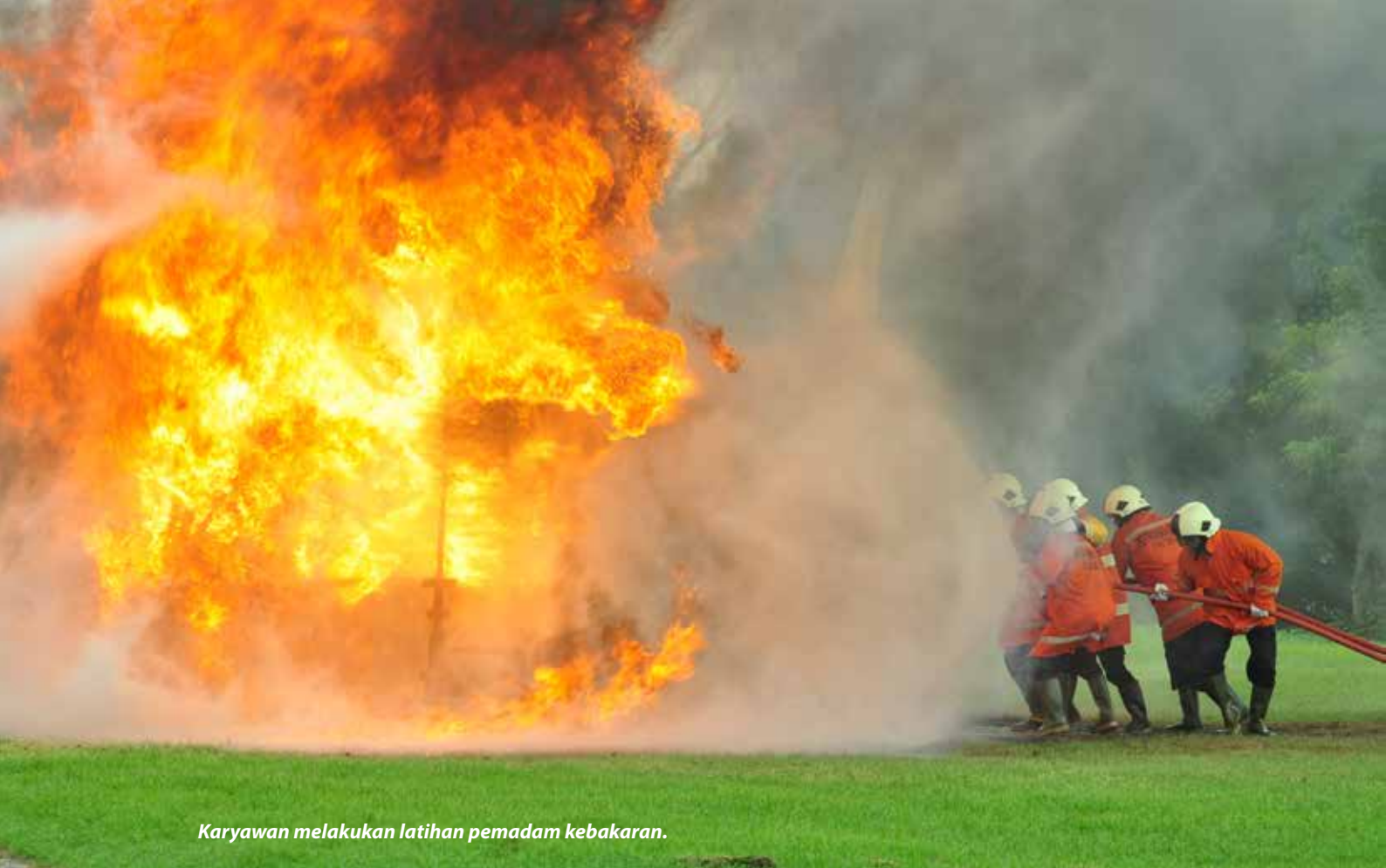
Karyawan melakukan latihan pemadam kebakaran.