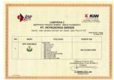
Sertifikasi Produk Tipe 5 Pupuk NPK Padat - Lampiran 2 Product Certification Type 5 Solid NPK Fertilizer - Attachment 2