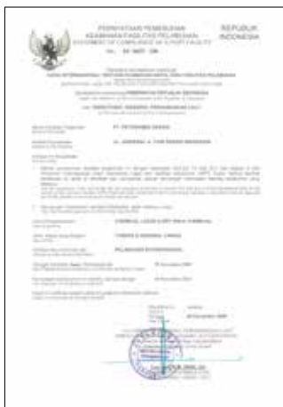
Sertifikat Pemenuhan Keamanan Fasilitas Pelabuhan Security Certificate of Compliance Port Facilities