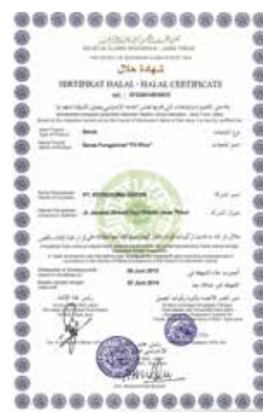
Sertifikat Halal Jenis Produk Beras "Fit Rice" Halal Certificate Fit Rice Product Type