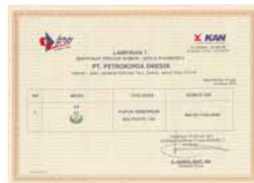
Sertifikasi Produk Tipe 5 - Pupuk ZA - Lampiran 1 Product Certification Type 5 - ZA Fertilizer - Attachment 1