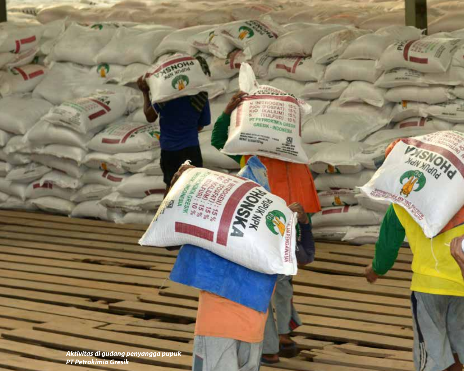
Aktivitas di gudang penyangga pupuk PT Petrokimia Gresik