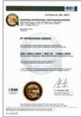
ISO 14001:2004/ SNI 19 - 14001: 2005