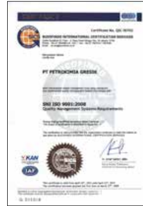
SNI ISO 9001 : 2008