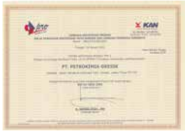
Sertifikasi Produk Tipe 5 - Pupuk DAP Product Certification Type 5 - DAP Fertilizer