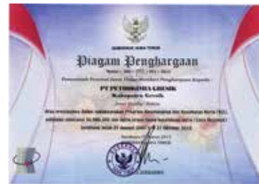
Zero Accident 56,980,305 Jam Kerja Aman Zero Accident 56,980,305 Safe Work Hours