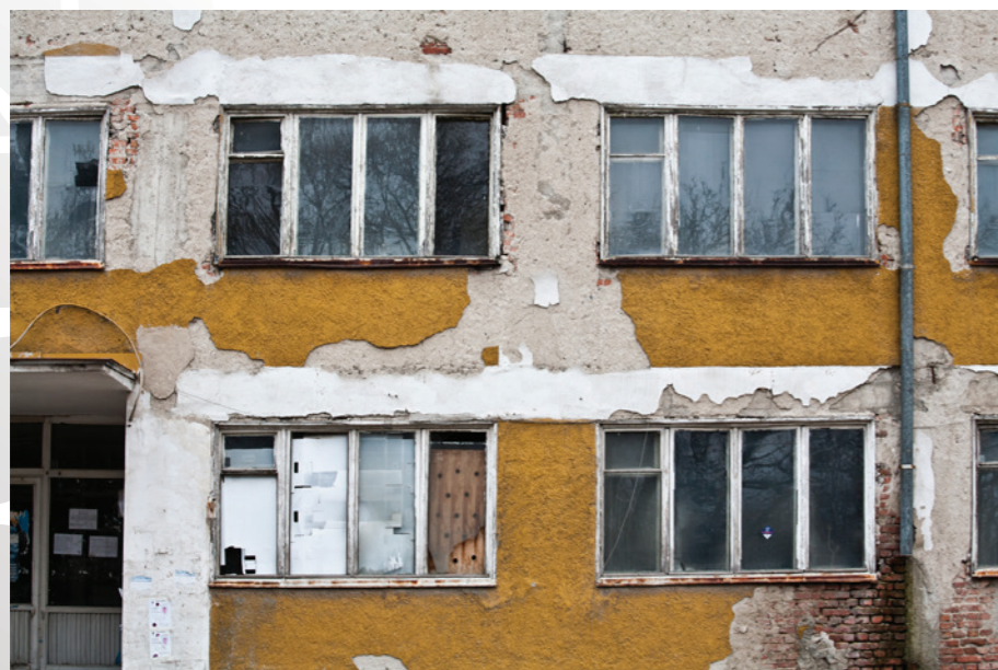
гр. Бобов дол

Анализът на финансовите резултати в този доклад показва, че тази „империя“ е в дълбок упадък, със задължения за над 1.1 млрд. лв. и амортизирани производствени мощности. Предстои ликвидация на производства, както вече се е случило с някои мини, включително подземните участъци на „Въгледобив Бобов дол“. Ще изникват въпроси, свързани с масови уволнения и безработица в общините, както и с рехабилитация на старите мини. Протекциите при създаването на тази бизнес структура вдъхват опасения, че общественият интерес няма да бъде взет под внимание, когато се стигне до поправяне на щетите след надвисналия разпад iii .