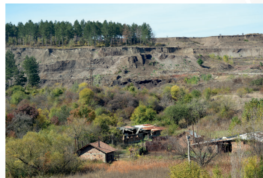
Бъдещето на въглищата е под земята

Алтернативата се нарича „законност“ и включва зачитане на публичния финансов интерес, опазване на околната среда и съпричастност към положението на работниците. В България това е задача, която ще изисква много усилия в следващите десетилетия, но работата може да започне още днес с преустановяване на незаконната ценова субсидия, с подкрепа за човешките права на миньорите и с адекватни мерки срещу замърсителите.