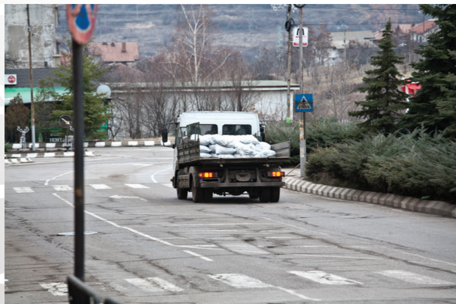
Въглищата са ежедневие в Бобов дол

Въглищните мини в Бобов дол, разположени на 60 км югозападно от София, предлагат изключително опасни условия на труд. На 19 септември 2017 г. миньор загива там, след като върху главата му се срутва голям пласт въглища. На 22 декември 2016 г. в същата мина миньор е смазан от машина, която разтоварва въглищата. През последните 10 години са регистрирани пет смъртни случая по време на работа, както и ред други трудови злополуки.