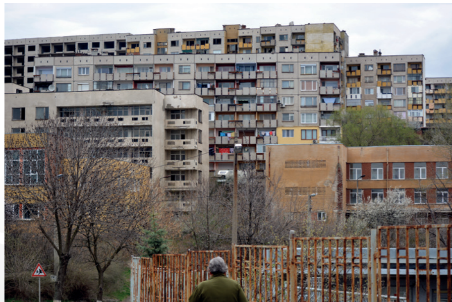
Какво е бъдещето на гр. Бобов дол отвъд въглищата

Синдикатите, загрижени на първо място за топящите се работни места, не заемат убедителна позиция. Все пак профсъюзен лидер в ТЕЦ „Бобов дол“ коментира през 2017 г.: „Заплащането никога не е било редовно... Заплатите се получават със закъснение 2-3-4 месеца. Работни дрехи не са получавани от 3-4 години“ xxiv .