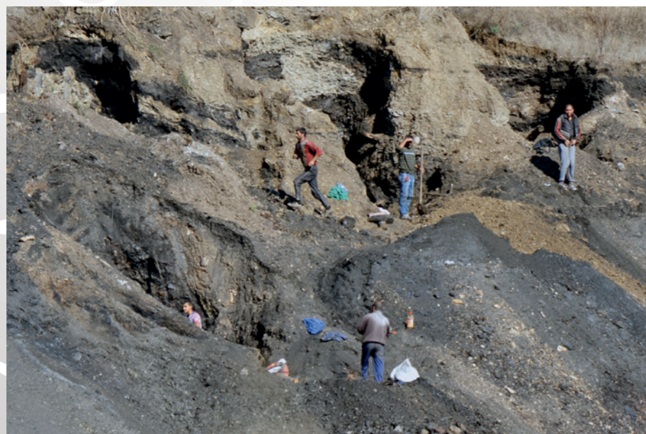
Миньорите работят за 300-400 евро на месец при опасни условия на труд

В края на октомври 2016 г., заради неизплатени заплати за август и ваучери за храна за март, както и неясно бъдеще на работните си места, 115 миньори от „Въгледобив Бобов дол“ остават три денонощия под земята. На някои им прилошава и са изведени принудително. В крайна сметка работниците си получават дължимото, тъй като протестът им се превръща в национална новина и парламентът и премиерът са принудени да вземат отношение.