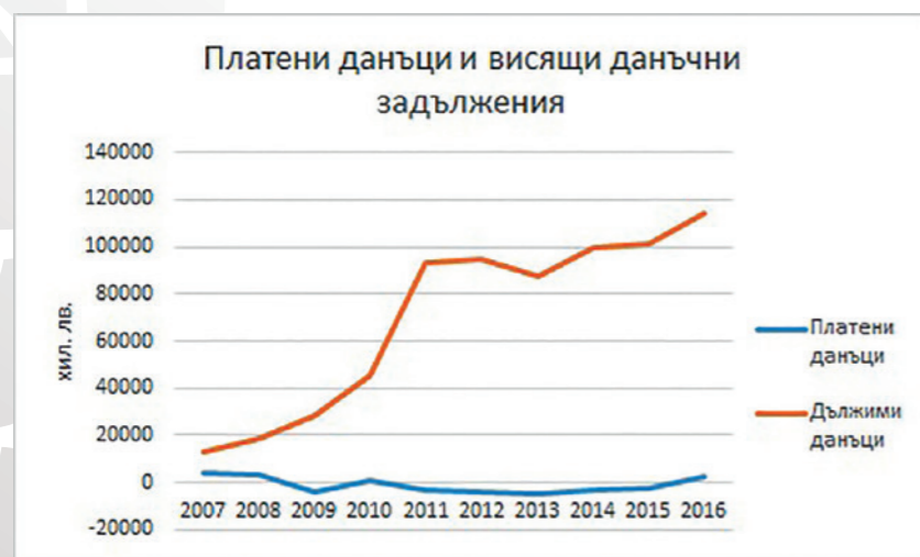
Графика 2: Платени данъци и данъчни задължения за периода 2007 – 2016 г.

• Неразплатени данъчни задължения в размер на 114 млн. лв. Те трябва да се разгледат успоредно с „данъчната неутралност“ на този бизнес. Той работи предимно на загуба, и тъй като компанията имат право да приспадат загубите от данъчната печалба в следващи периоди, то общата сума на платените данъци е негативна. Тоест, от счетоводна гледна точка данъците не са разход, а приход за тези дружества. Общо за 19-те фирми в разглеждания 10-годишен период, данъчният приход е над 9 млн. лв.