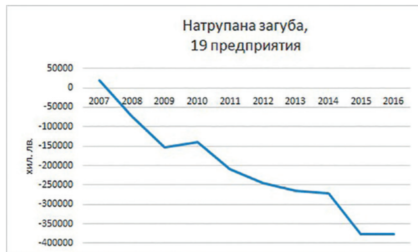
Графика 1: Натрупани загуби за периода 2007 – 2016 г.

В периода 2007 – 2016 г. дружествата, причислени към тази група са реализирали общо 7.21 млрд. лв. приходи от продажби. Според финансовите отчети, тяхната дейност в дългосрочен период като цяло е губеща: към края на 2016 г. групата е натрупала загуби от общо 360 млн. лв.