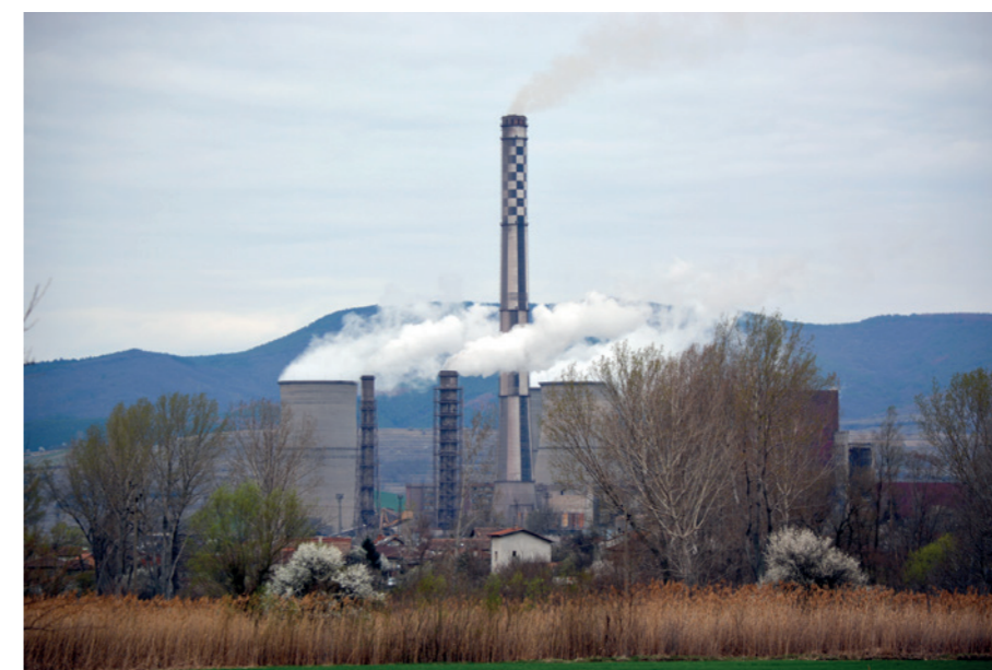
Топлоцентралиите на въглища са динозаври на една енергийна система, която трябва да остане в миналото

Тази зле прикрита държавна помощ не изчерпва облагите, които предприятията от „втория въглищен ешелон“ извличат от публичните фондове. През зимните месеци с пиково потребление енергийната система плаща на електроцентрали за „студен резерв“ – енергийни мощности, които влизат в експлоатация само ако в системата се появи дефицит. И трите ТЕЦ – „Брикел“, „Бобов дол“ и „Марица 3“ участват в тази схема. В студения януари 2017 г. се налага активиране на резервните мощности, но и трите централи не са в състояние да ги задействат, въпреки че им се плаща, за да ги държат в изправност.