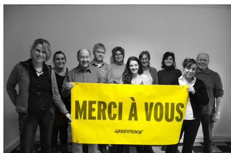
L'équipe Greenpeace Luxembourg

publiques, pas de contribution d'entreprises, notre financement dépend à 100% de nos adhérents et de notre capacité à collecter des fonds nous-mêmes, d'où la part allouée à la collecte dans notre budget. C'est pourquoi plus nous prenons d'ampleur dans nos campagnes, plus nous avons besoin de vous pour agir.