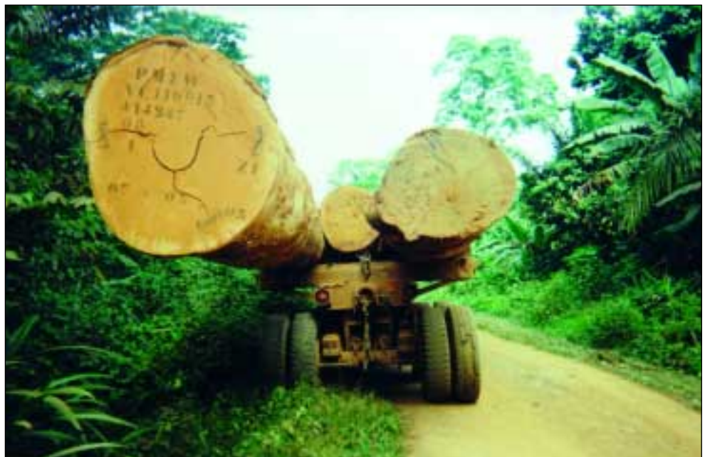
Reef-hout dat op weg is naar de houtzagerij