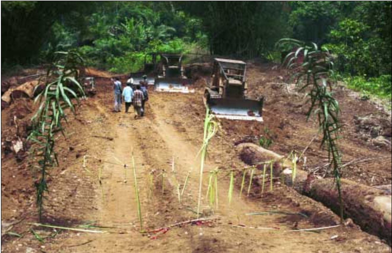
Traditionele blokkade die door de inwoners van Molongo is opgeworpen om de houtkapactiviteiten van Reef te stoppen.