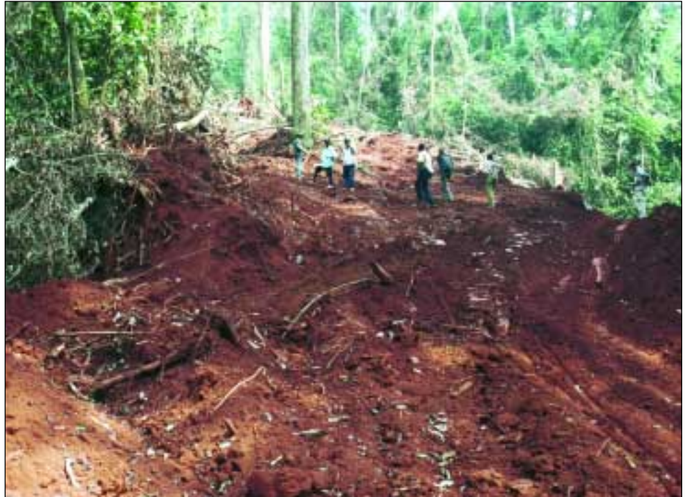
Kapwegen in Reef's vente de coupe 11-06-13