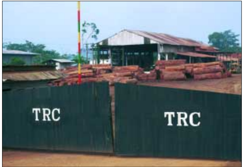
Reef-houtzagerij in Kumba