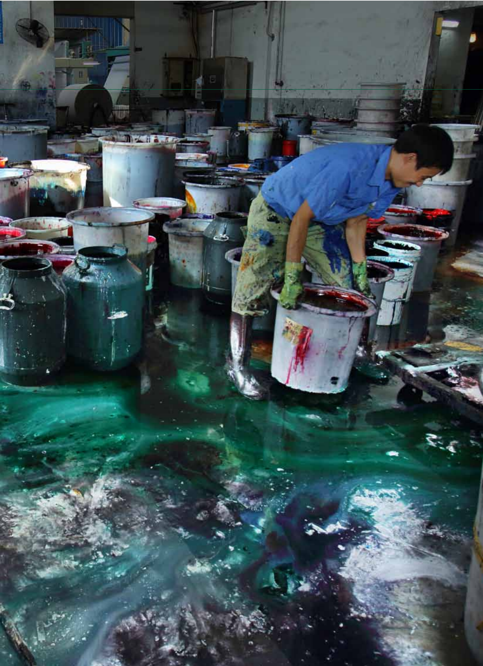
Färberei in Shaoxing in China. In dieser Fabrik werden jeden Tag ungefähr 2500 kg Färbemittel verwendet.