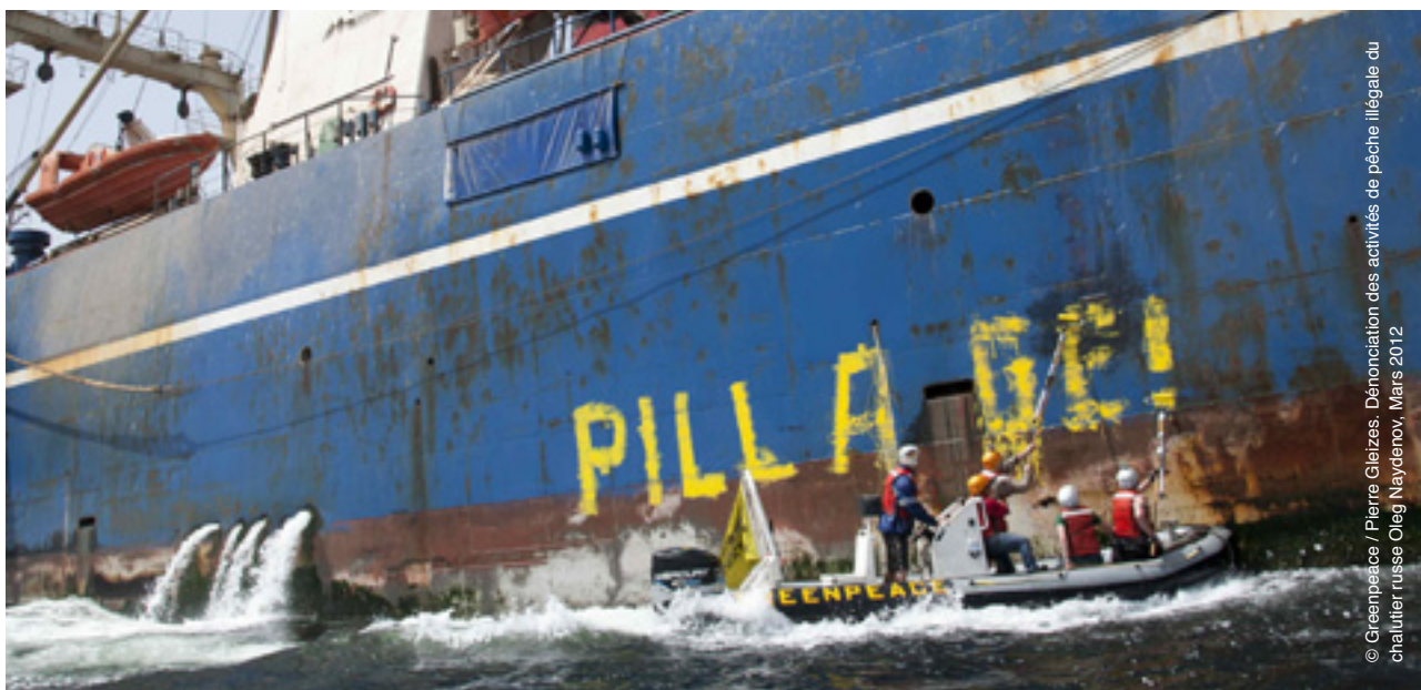
Dénonciation des activités de pêche illégale du chalutier russe Oleg Naydenov, Mars 2012

L' Accord n'inclut donc aucune disposition autorisant les chalutiers pélagiques russes à opérer dans les eaux sous juridiction sénégalaise, et les négociations sur un éventuel Protocole de mise en œuvre semblent être au point mort. L'Agence fédérale russe des Pêches et le DG de la Murmanskij Trawl Fleet feront pourtant référence, abusivement, à cet Accord pour tenter de légitimer la présence de leurs navires au Sénégal en 2012. 27