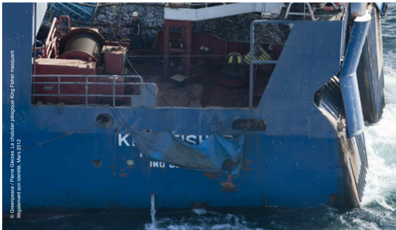
Le chalutier pélagique King Fisher masquant illégalement son identité, Mars 2012

Quoiqu'il en soit, le cabinet du Ministre va se lancer dans une nouvelle tentative de « légaliser » la présence des chalutiers pélagiques étrangers dans la ZEE sénégalaise. Puisqu'il n'est décidément pas possible de faire rentrer ces autorisations de pêche dans le cadre légal, c'est le Code de la Pêche qu'il va s'agir de modifier!