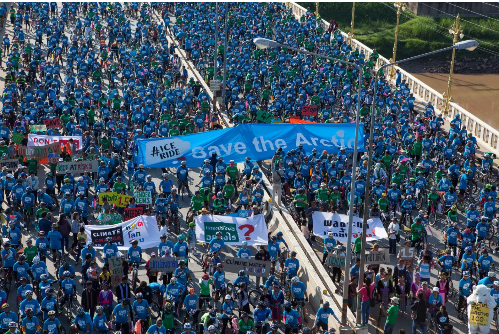
Plus de 1200 personnes manifestent en faveur de l'Arctique lors du Ice Ride

Greenpeace n'émet pas de revendication sans en même temps proposer une solution pour y parvenir. Nous faisons avancer des solutions techniques concrètes aux problèmes environnementaux. Le réfrigérateur Greenfreeze sans réfrigérant nocif pour la couche d'ozone, la SmILE qui est une voiture avec une consommation minimale de carburant et le Projet solaire jeunesse de Greenpeace Suisse montrent que des solutions existent.