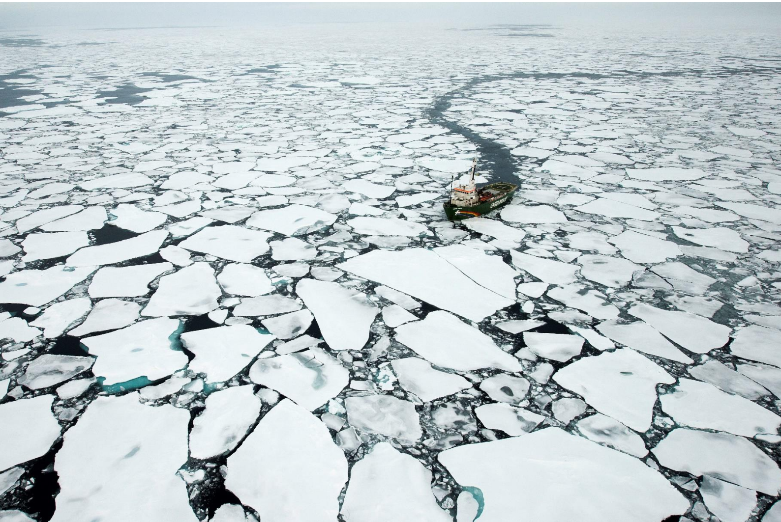
L'Arctic Sunrise lors d'une expédition dans l'Arctique pour examiner la banquise.

Greenpeace est fière de sa propre flotte de haute mer. Trois bateaux de haute mer parfaitement équipés, dont le Rainbow Warrior, constituent la colonne vertébrale de nos campagnes et de notre travail de recherche. Nous les engageons pour des expéditions scientifiques, des actions directes non violentes et des tournées d'information publiques. Nous dévoilons de graves atteintes à l'environnement des océans – même dans des régions difficiles d'accès. Nous diffusons notre message dans tous les endroits que les autres ne peuvent ou ne veulent pas atteindre.