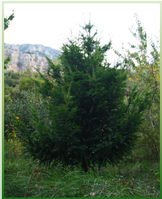
Tejo de la Fte. La Lándiga