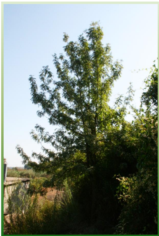
Serbal de Fte. La Murta (supera los 4 m.)