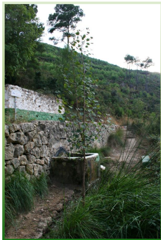
Arce de la Fte. Umbría