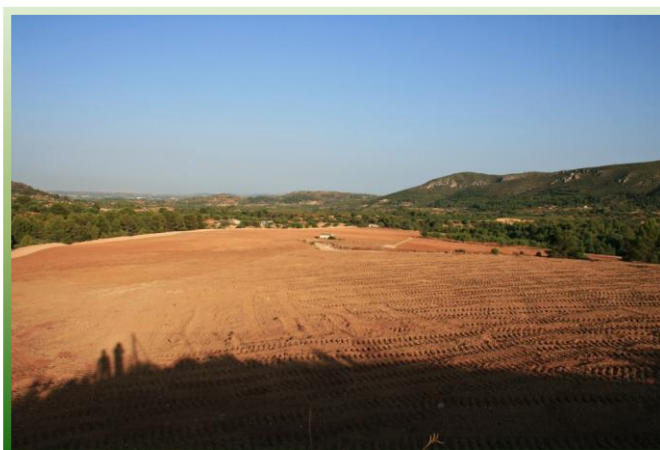
Transformación actual en Las Salinas

Creemos que dado el panorama que se nos presenta, se debería replantear la explotación del último acuífero que nos queda, con una visión inteligente a medio y largo plazo y que las generaciones futuras puedan disponer de este agua para poder sobrevivir.