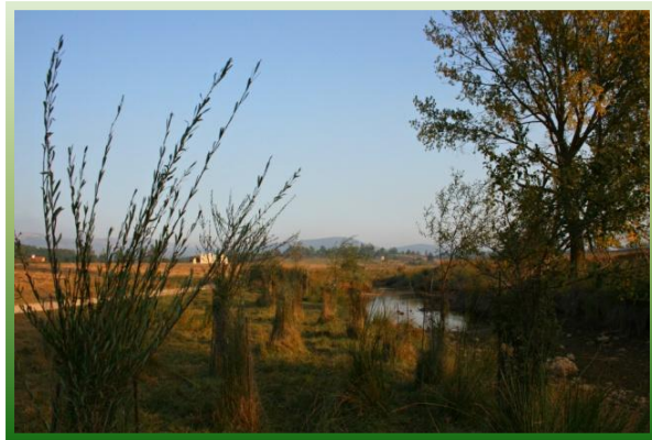
Restauración Barranco del Regajo (Marjana)