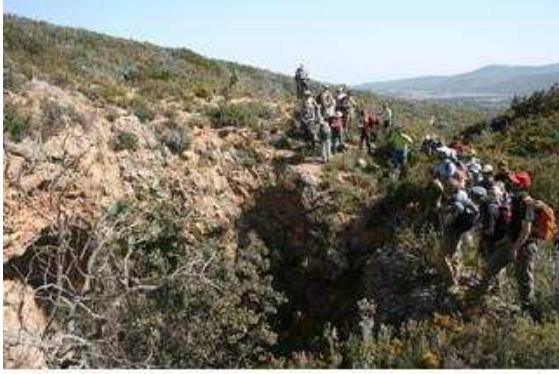
Sima de las Palomas