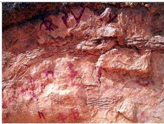
Detalle de las pinturas

Posteriormente subiremos en dirección oeste hacia el Burgal, para bajar posteriormente ya en dirección a Chera hasta el Albergue de la Puerca,