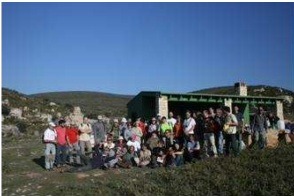
Refugio de Oratillos

El recorrido no es circular, si inicia en el Refugio de Oratillos (se puede pedir autorización para ocuparlo en el Ayuntamiento de Chiva) y término en el refugio de la Puerca (perteneciente al ayuntamiento de Chera), conviene llevar dos coches y dejar uno en cada refugio.