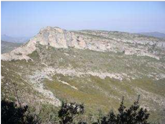
Barranco de la fuente de la Gota