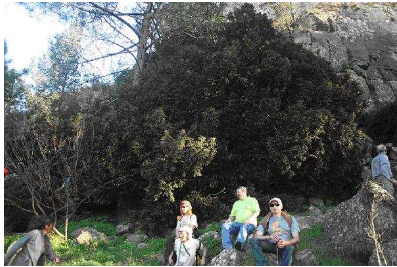
Uno de los tejos de la microrreserva

pero en este caso lo haremos pasando por la microreserva de La Puerca (16 ha), una de las tejas más importantes de la Comunidad Valenciana.