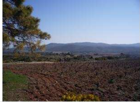
Llano de Mariana