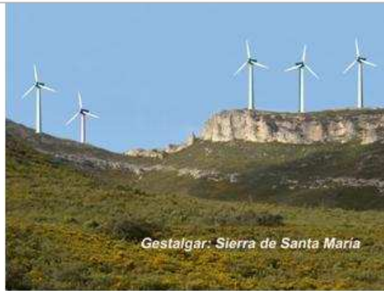
Lo mismo en el futuro si no se remedia

Una vez coronado el collado el punto geodésico es el más alto del término (1136 m), hay que ir en dirección sur para bajar al Barranco del Burgal y girar en dirección norte para bajar hasta la zona de Las Clochas, donde es obligatorio la visita a las pinturas rupestres , en la página http://www.amigosdegestalgar.com/ se puede encontrar la información exacta para localizar las pinturas.