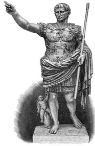
I – Imperio