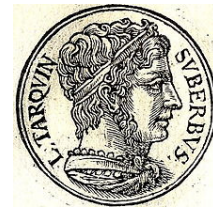
III - Monarquía

7. Las guerras púnicas son aquellas entre: