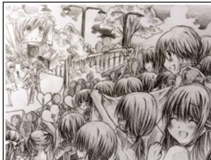
Gambar cukup terang, garis dan detil obyek terlihat jelas