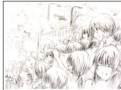
Gambar terlalu terang, detil obyek tidak terlihat