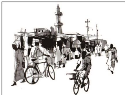
Gambar ditempatkan di tengah bidang, detil obyek terlihat jelas