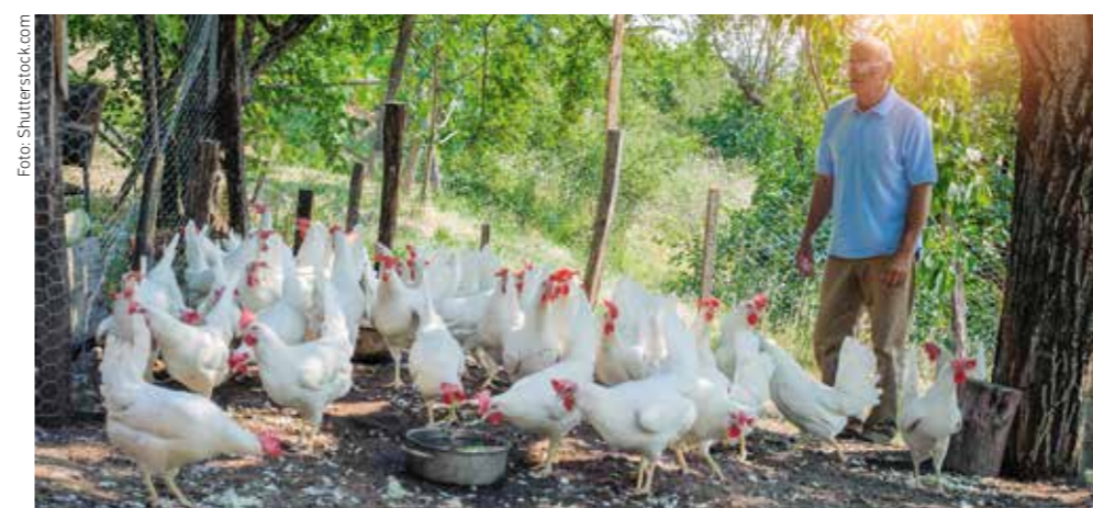
Balkánská země má v současnosti nedostatek drůbežního masa.

Pokud firma umístí nově založenou výrobní společnost do jedné z nerozvinutých obcí, má nárok na osmileté osvobození od daně ze zisku, a to až do hodnoty 200 tisíc eur. Dále může dostat subvence na vytvoření pracovních míst.