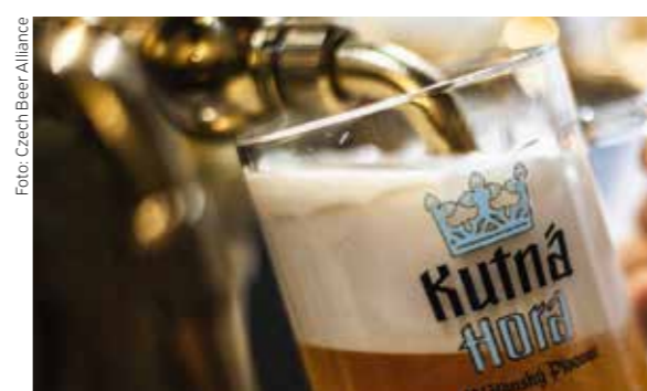
Ve Velké Británii nabídla pivní aliance jako jedno z kvalitních českých piv Kutnohorskou stříbrnou jedenáctku.