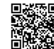
Přečtěte si více informací o exportních aliancích