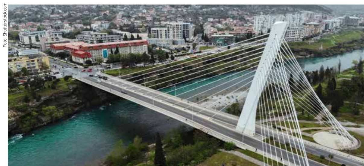
Černohorská metropole Podgorica se rychle mění v moderní město.