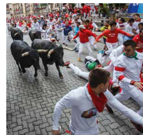
Úprk před býky při slavnosti Sanfermines.

Různá města pořádají fiesty oslavující některého ze svatých. Ve Valencii se v březnu konají slavnosti Fallas na počest svatého Josefa, v Pamploně se organizují kontroverzní Sanfermines, kdy se na svatého Fermína stahují do ulic muži v bílém oděvu doplněném typickým červeným šátkem,