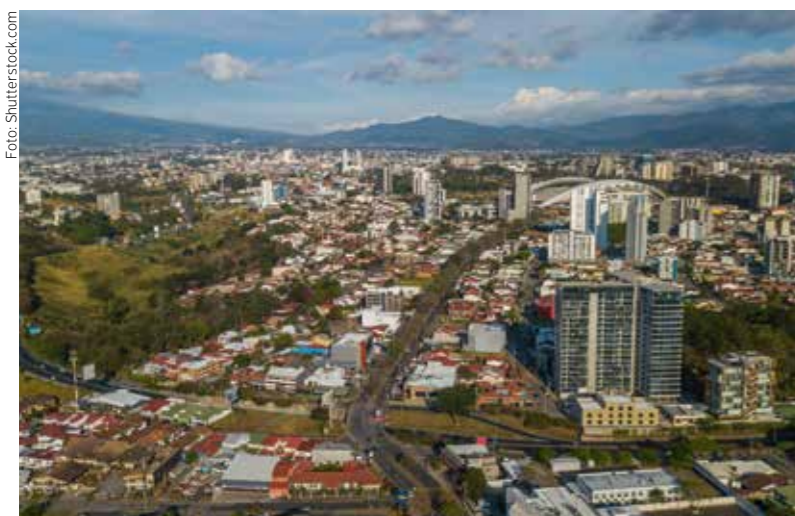
Na předměstí metropole San José chce český developer UDI Group postavit patnáctiposchodový bytový dům.

Vzhledem k potenciálu „středoamerického Švýcarska“, jak se někdy Kostarice přezdívá, je tam česká obchodní přítomnost zatím zanedbatelná. Vývoz dosahuje ročně jen asi 200 milionů korun. Naopak dovoz z Kostariky do Česka se v roce 2020 vyšplhal až nad hodnotu pěti miliard korun. Podstatnou část této sumy představuje nákup mikroprocesorů Intel vyrobených v Kostarice, které odebírají české podniky. Zajímavým českým počinem v kostarickém turistickém průmyslu je hotelový Resort Art Villas citlivě zakomponovaný do prostředí tropické vegetace, jehož architekturu navrhlo české studio Refuel Works. Velký projekt letos ohlásila developerská skupina UDI Group. Koupila pozemek v progresivní oblasti Barrio Escalante poblíž metropole San José. V lokalitě se nacházejí univerzity či hipsterské restaurace a český developer tam hodlá postavit patnáctiposchodový dům se 120 byty. ✖