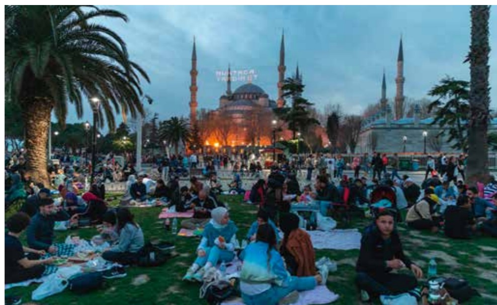
V Istanbulu muslimové během ramadánu rádi pojímají první jídlo dne – večerní iftár – formou společného pikniku v parku.

I ti, kteří v podnikání nebo své profesi pokračují i během svatého měsíce, ovšem podléhají únavě. Základní