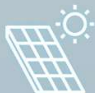
Tier 1 Solar Panel