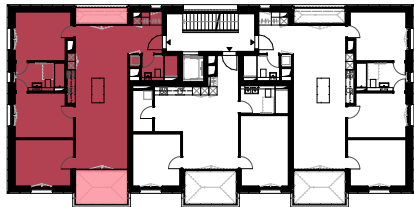
Übersichtsplan 3. Obergeschoss