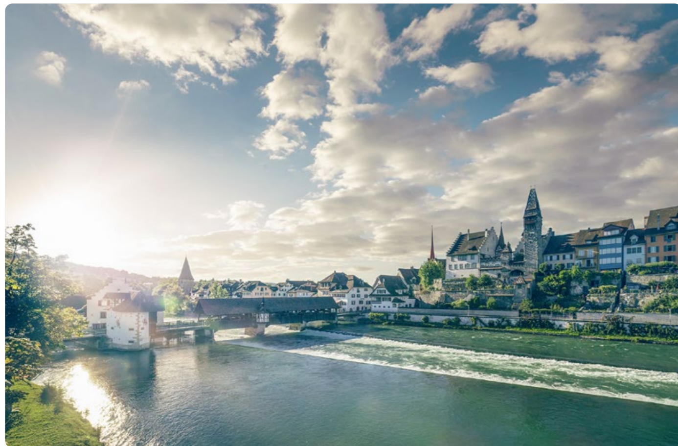
Bremgarten's historische Altstadt