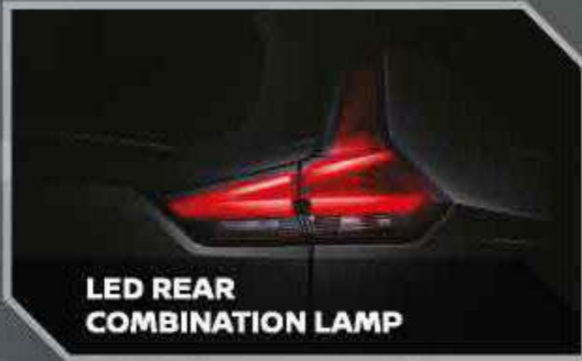
LED REAR COMBINATION LAMP

Rasakan tampilan layar modern untuk berkendara yang lebih efisien.