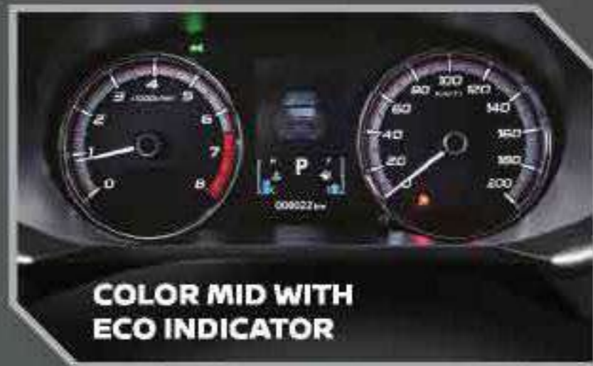
COLOR MID WITH ECO INDICATOR

Desain yang stylish dan lebih gaya dengan "Two-tone machining".