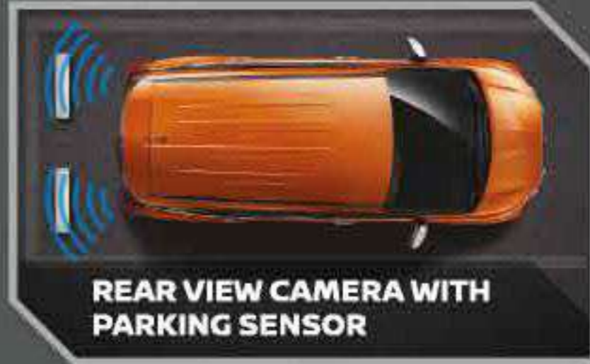
REAR VIEW CAMERA WITH PARKING SENSOR

Pencahayaan yang lebih optimal dengan LED, lebih modern dan percaya diri saat berkendara.