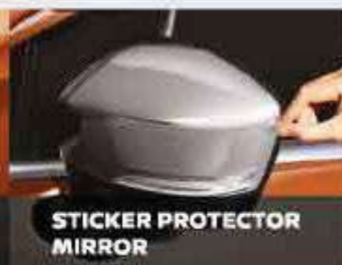
STICKER PROTECTOR MIRROR