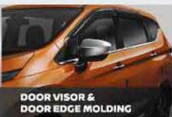
DOOR VISOR & DOOR EDGE MOLDING