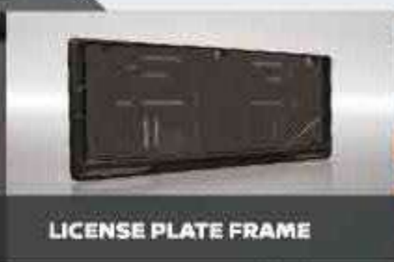
LICENSE PLATE FRAME