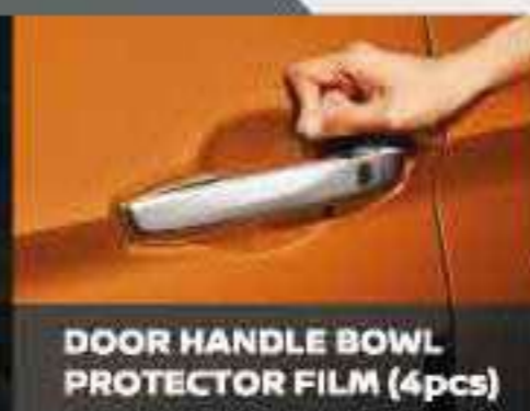
DOOR HANDLE BOWL PROTECTOR FILM (4pcs)