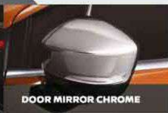
DOOR MIRROR CHROME