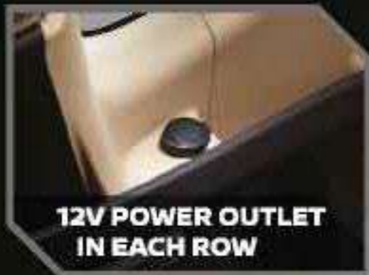
12V POWER OUTLET IN EACH ROW

Tersedia charging port untuk kebutuhan penumpang di setiap baris.