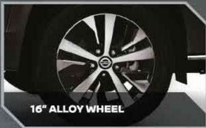
16" ALLOY WHEEL

Desain yang stylish dan lebih gaya dengan "Two-tone machining".