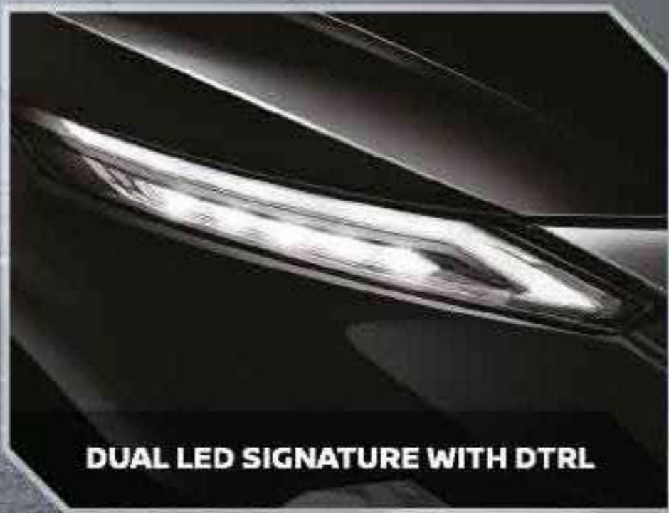
DUAL LED SIGNATURE WITH DTRL