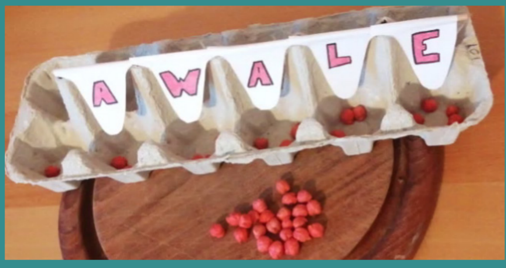
Awalé - Boîte d'oeufs et haricots