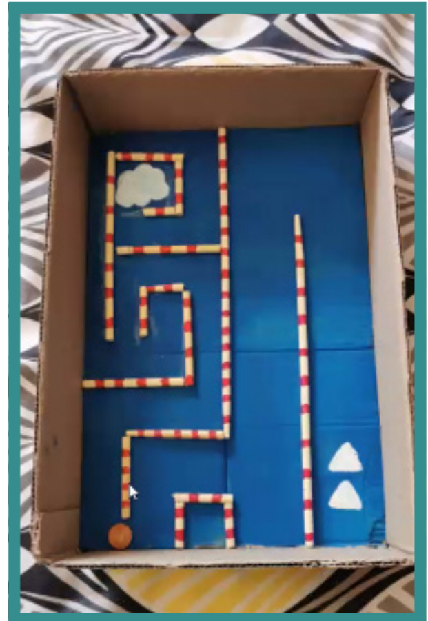
Labyrinthe avec pièce