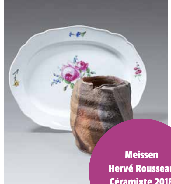
Meissen Hervé Rousseau Céramixte 2018

Apparue à l'époque du néolithique, la plus ancienne forme de céramique est la poterie qui servait à fabriquer des objets utilitaires. Ces premières poteries étaient façonnées à la main à partir de terre puis simplement séchée au soleil ce qui les rendaient extrêmement fragiles.