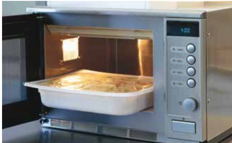
2. La cuisson douce des aliments dans leur propre jus au micro-ondes (env. 4–6 min)