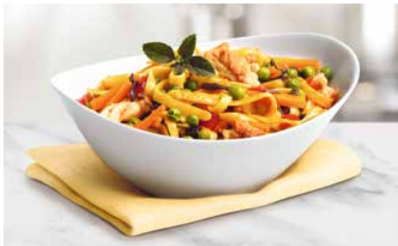
4. Servir ou maintenir au chaud