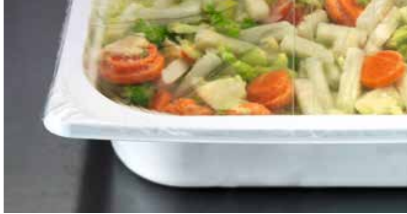
1. Portionnement optimal bols GN ½ (réfrigérés ou congelés)