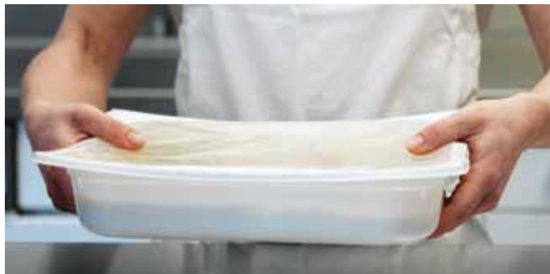
3. Laisser reposer env. 2 min, tourner un peu le bac