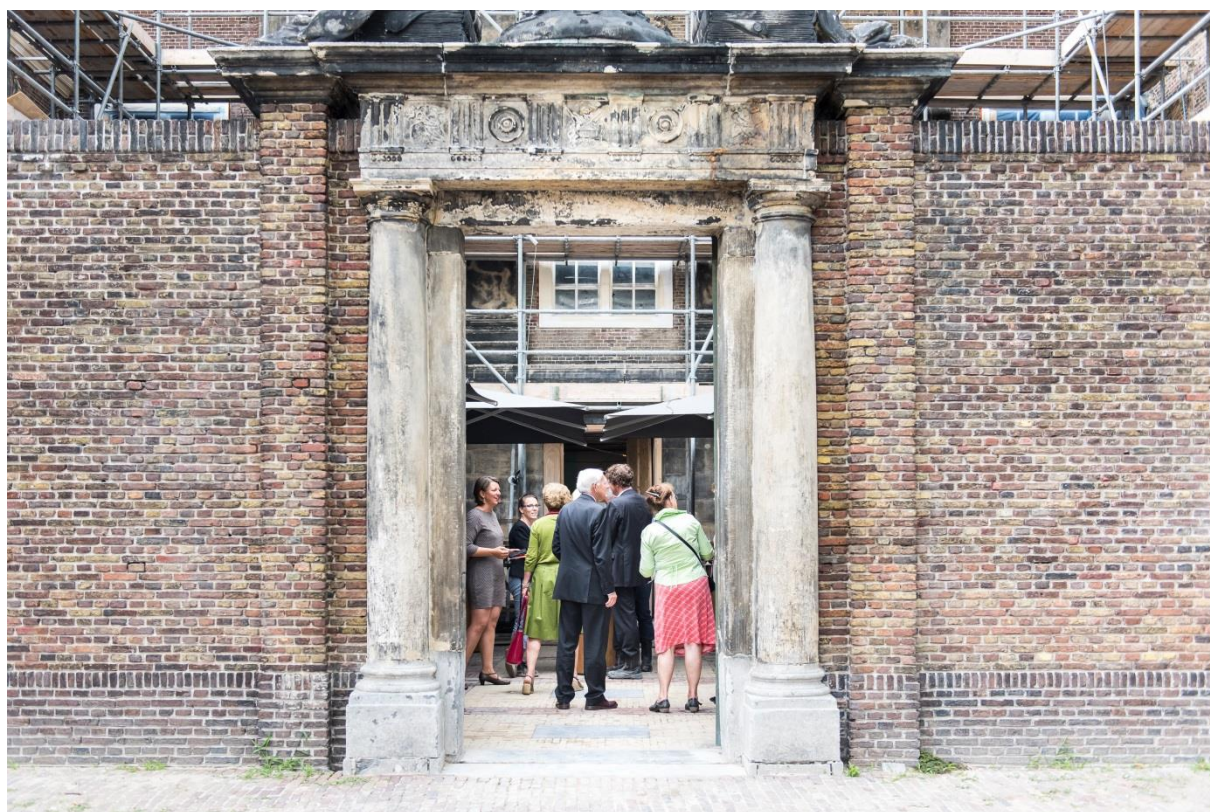
Borrel Lucas van Leyden Mecenaat op 26 juni 2017. Locatie: voorplein Museum De Lakenhal tijdens de restauratie en uitbreiding.