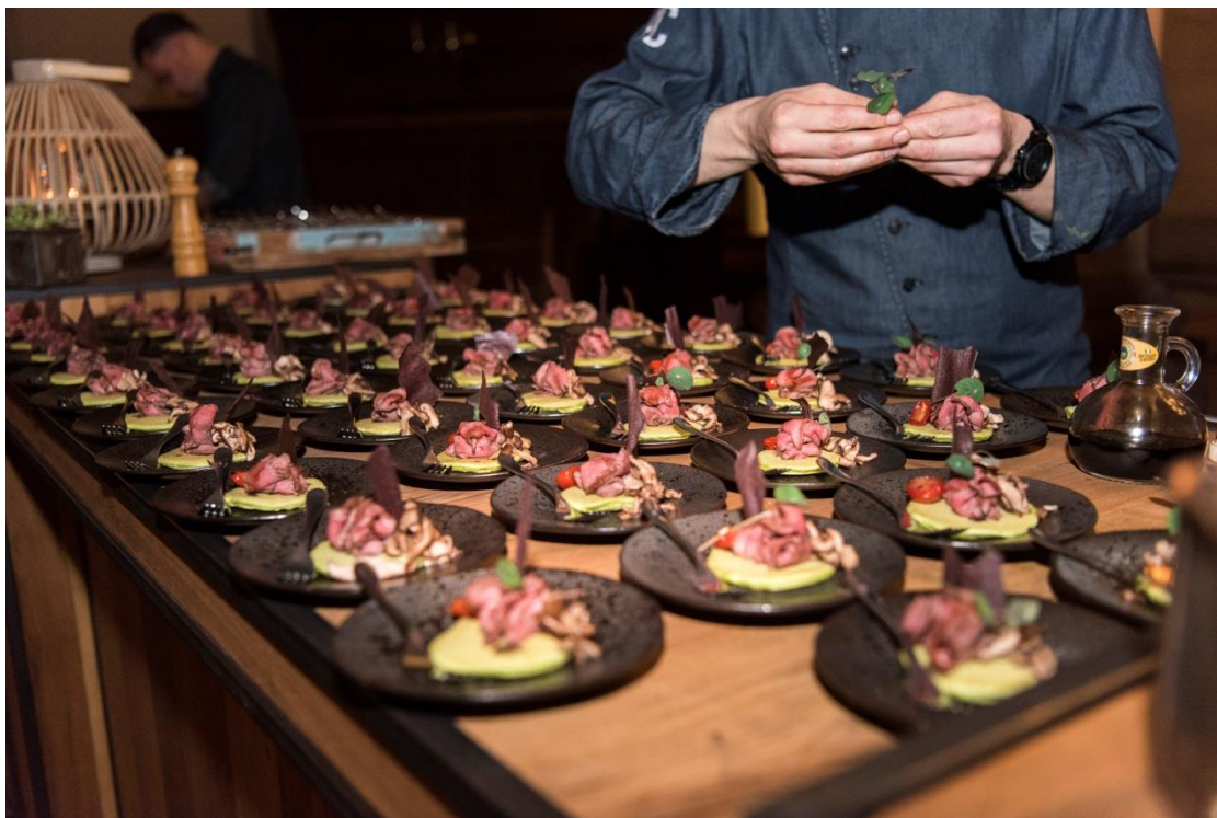
Diner Lucas van Leyden Mecenaat in de Marekerk op zaterdag 25 november 2017.