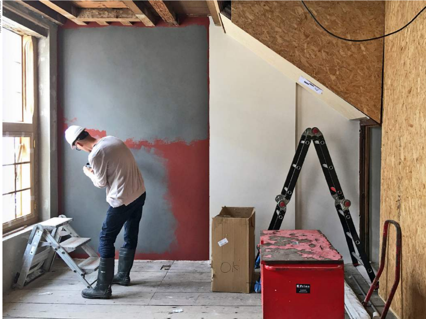
Eén van de eerste kleurtesten op groot oppervlak. Door diverse kleurlagen toe te passen ontstonden verrassende tinten en effecten, met een uniek Rembrandtpalet voor Museum De Lakenhal als resultaat.