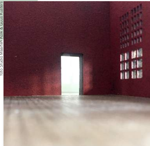
Een maquette van een zaal voor het vernieuwde Museum De Lakenhal, met een kleurproef van Kolk & Kusters.