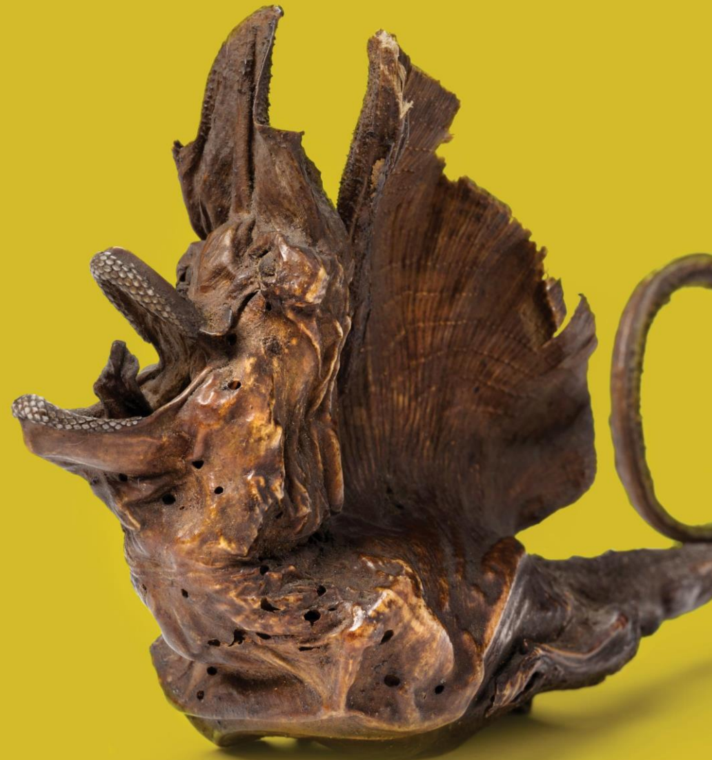
Rog gevouwen in de vorm van een draak Bruikleen Naturalis Biodiversity Center

“Doordat de tentoongestelde attributen afkomstig zijn uit de collecties van musea met zoveel verschillende disciplines, verrast de expositie je constant.” – Dagjeweg.nl “Waarom maken vervalsers een nep-object? En hoe ontdekken conservatoren een vervalsing? In Museum De Lakenhal krijg je antwoord op deze vragen in de tentoonstelling Misleiden – Fakes uit kunst en wetenschap.” – Quest