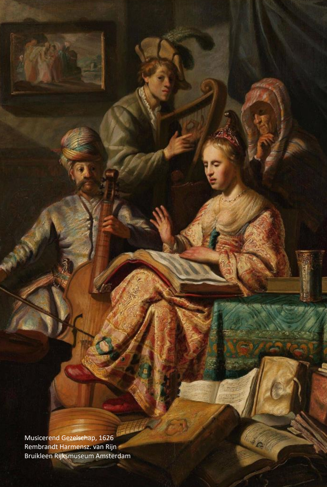
Musicerend Gezelschap, 1626 Rembrandt Harmensz. van Rijn Bruikleen Rijksmuseum Amsterdam