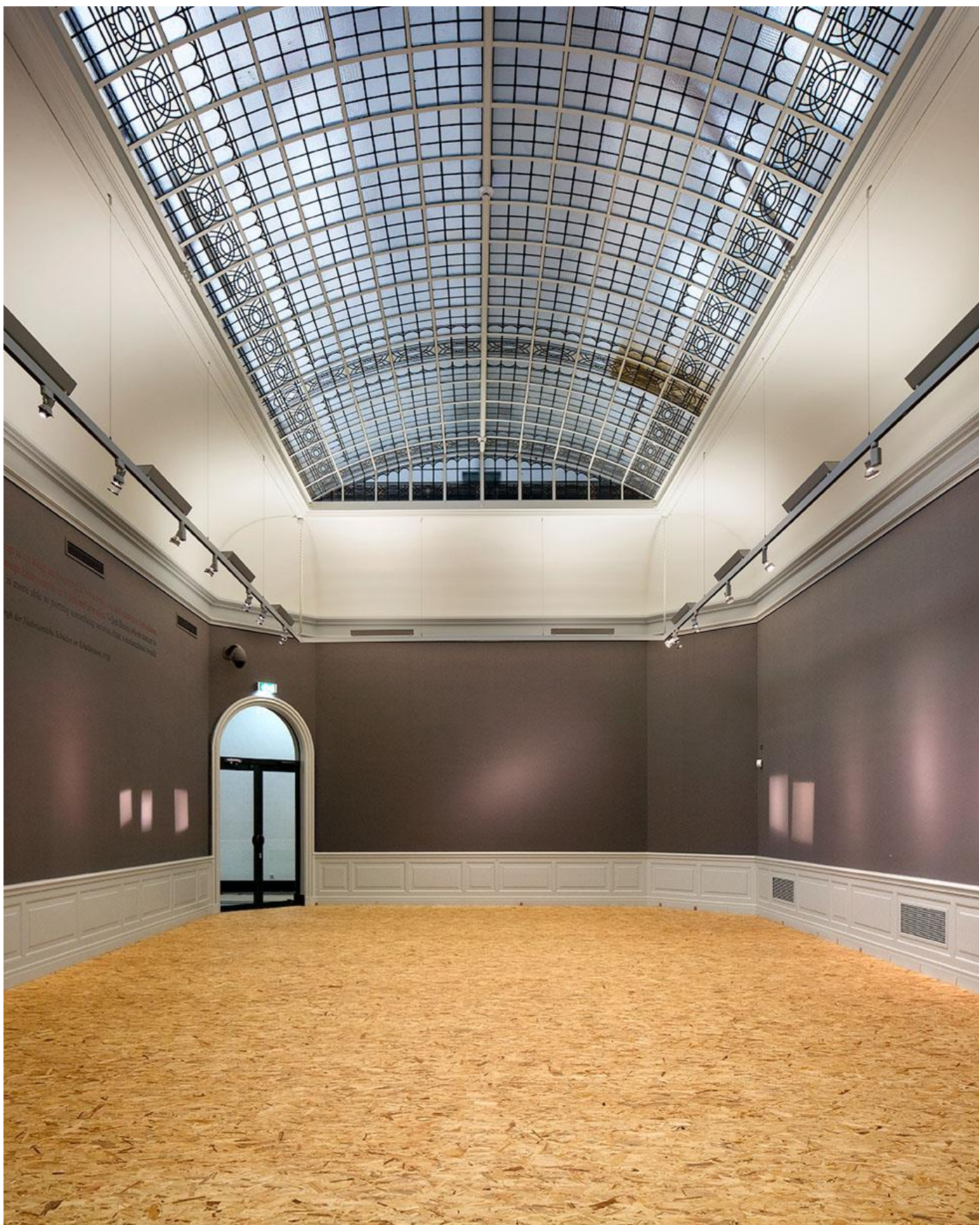
Karin Borghouts, museum in transitie, 2017