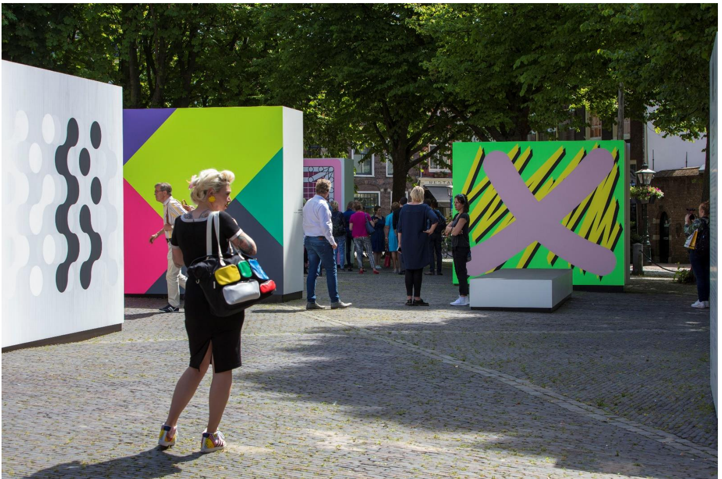
Openlucht Museum De Lakenhal

Leiderdorp), Zedz (1971, Leiden), Sigrid Calon (1969, Den Bosch)