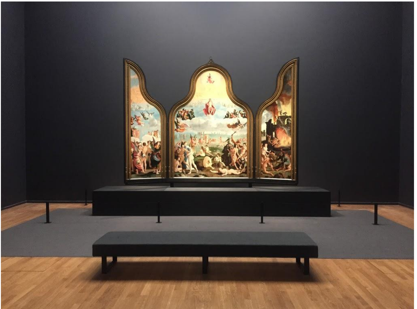
Lucas van Leyden, Laatste Oordeel , 1526/27 – te gast in het Rijksmuseum