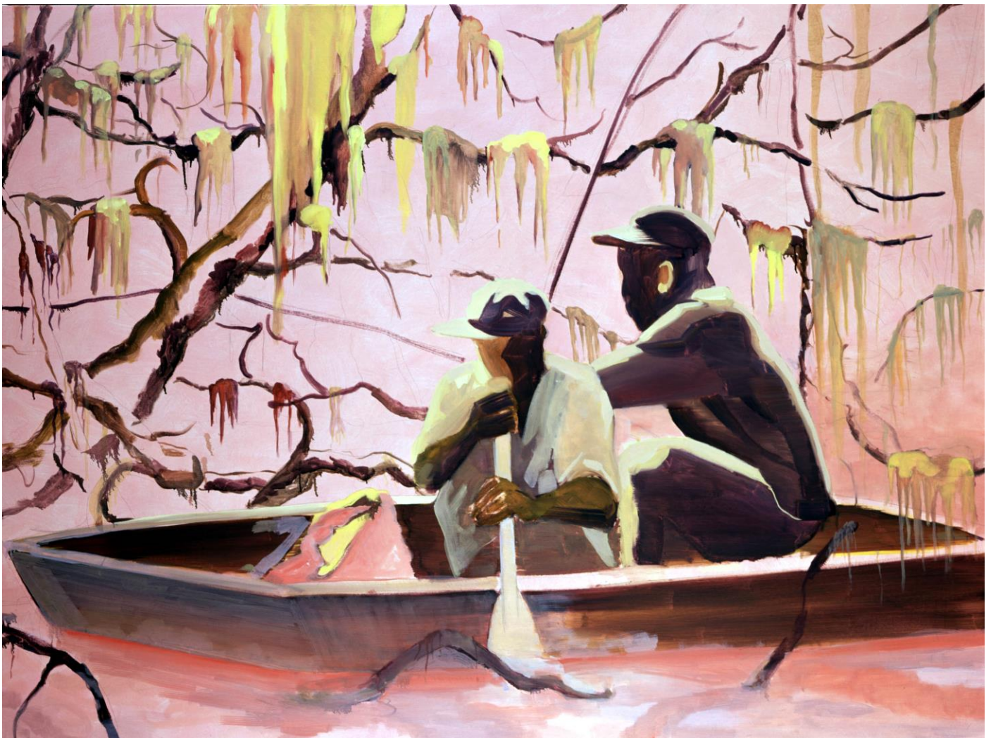
Maurice Braspenning, Swamp, olieverf op doek, 2001 Museum De Lakenhal op locatie: Natuurlijk