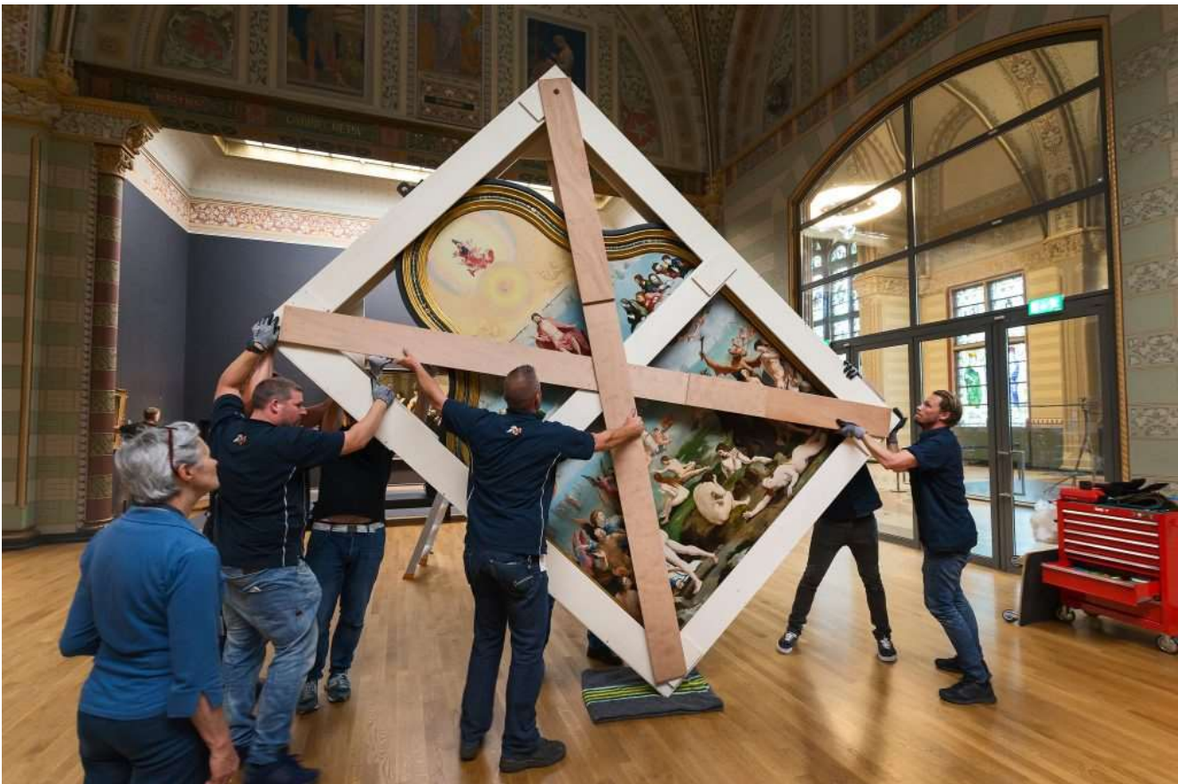
Topstuk Laatste Oordeel van Lucas van Leyden, komt aan in de eregalerij van het Rijksmuseum augustus 2016.