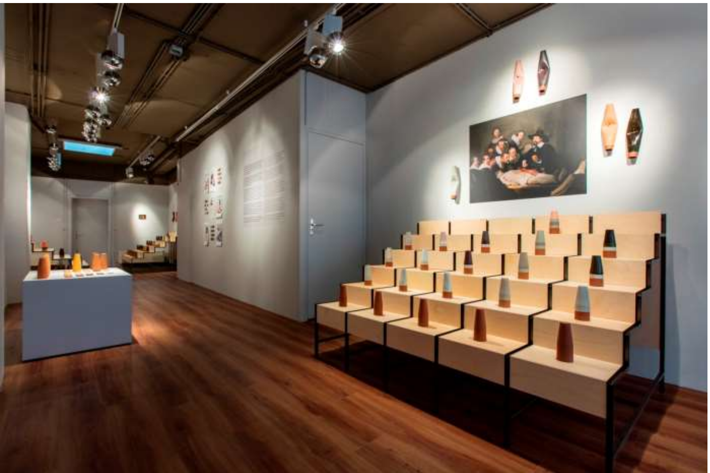
Presentatie van het RembrandtLAB in Leiden, in het voormalig atelier van Jacob van Swanenburgh, Rembrandt's leermeester