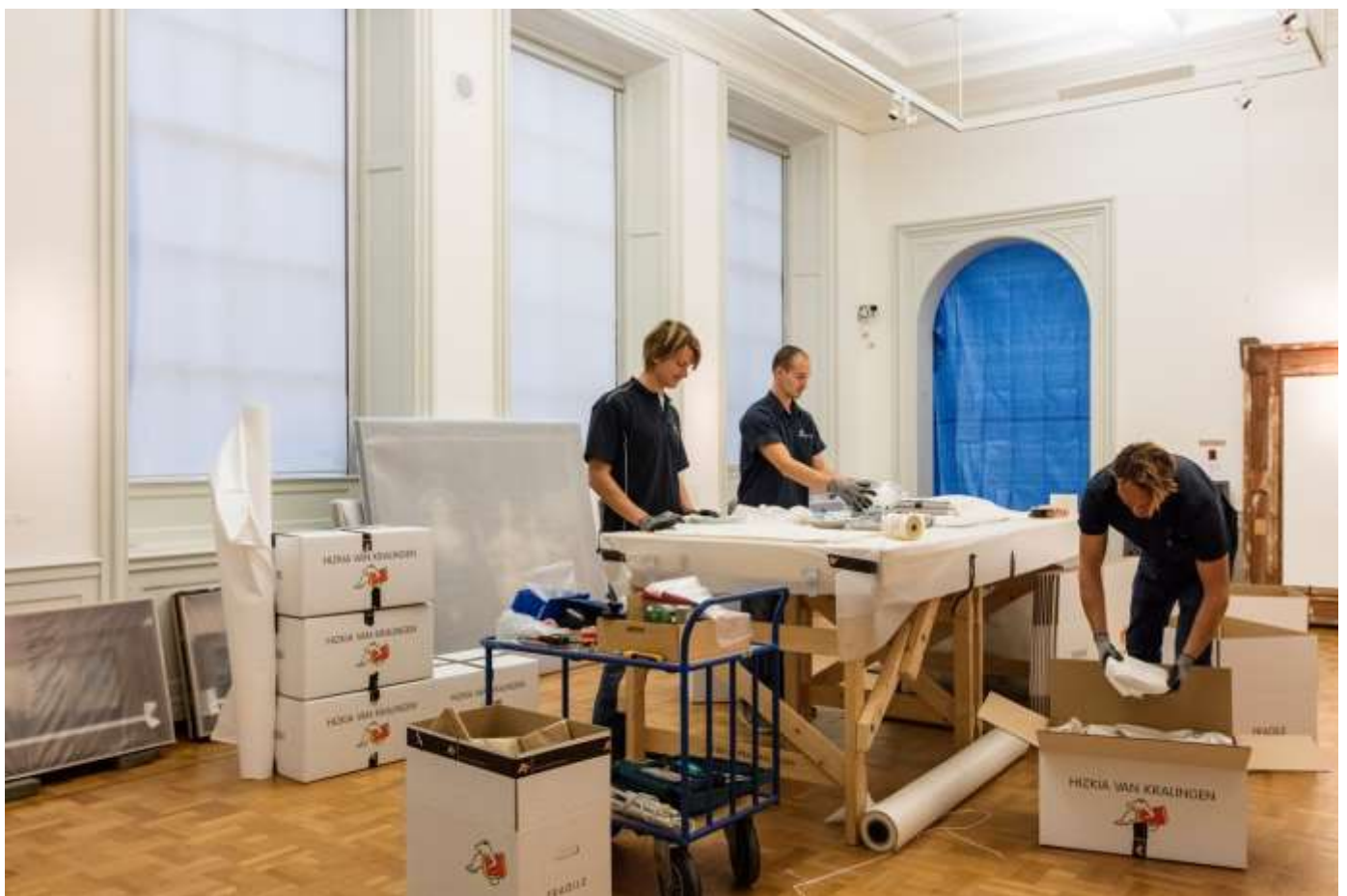
Uithuizing van de collectie.