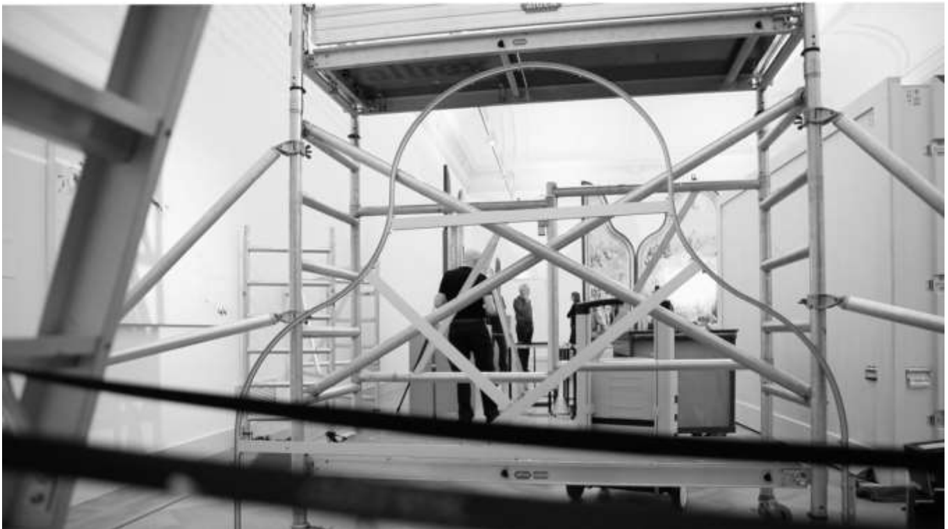
Uithuizing Lucas van Leyden drieluik.