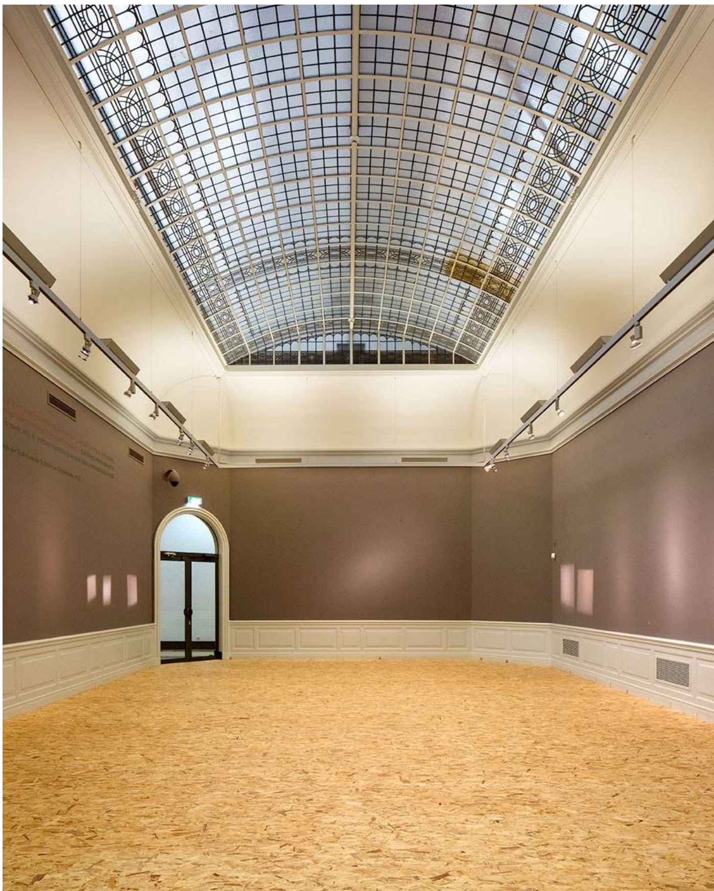
Museum in transitie.