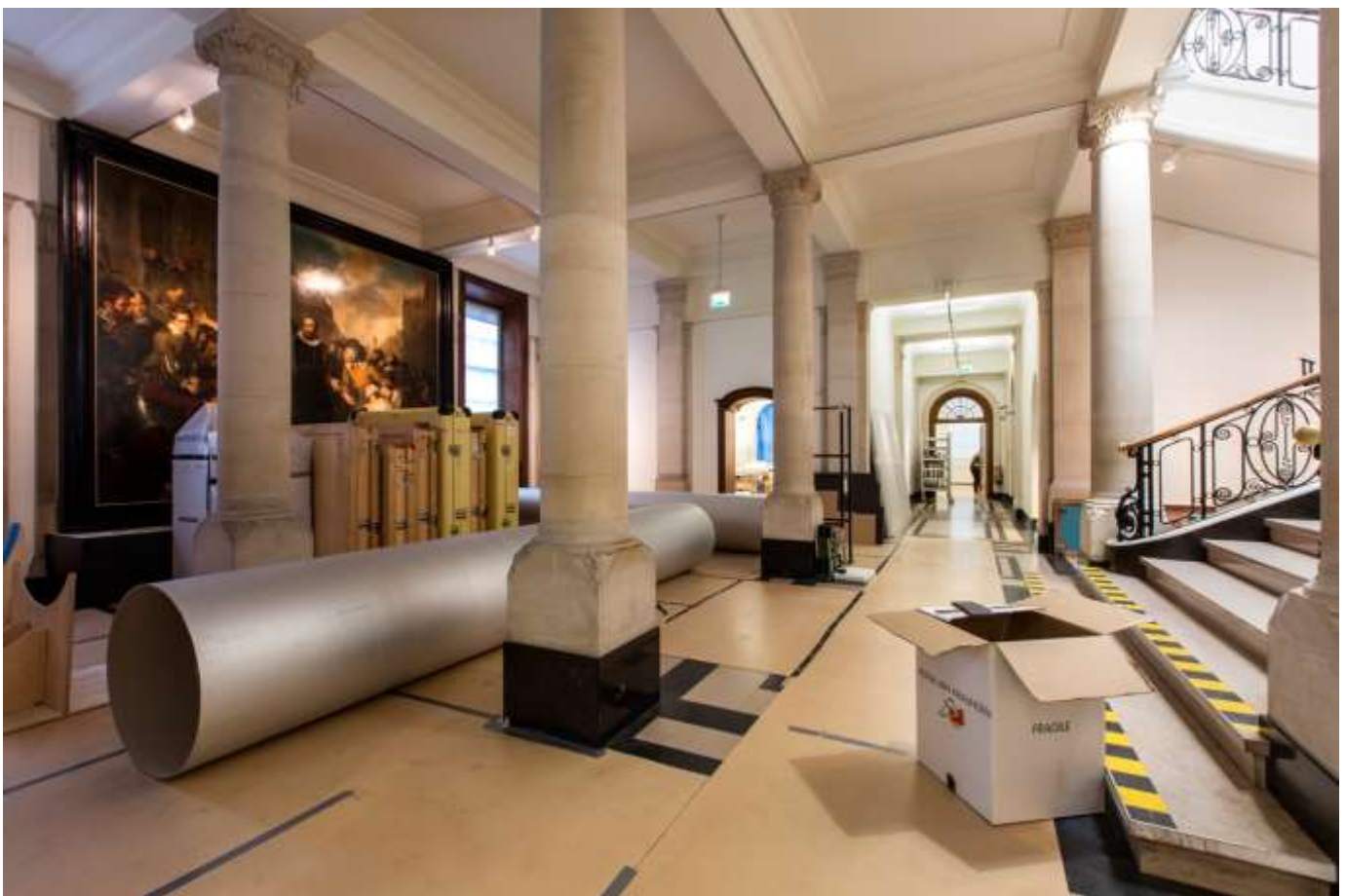
Uithuizing van de collectie.

8551.2 Anoniem, Gedenksteen Leidens Ontzet, ca 1577