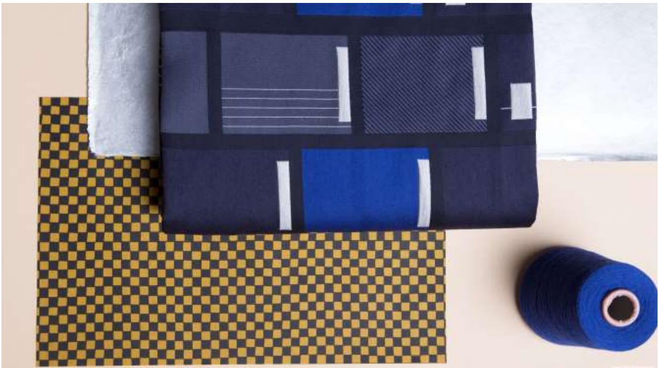
Nieuw Leids Laken #2, ontwerp Mae Engelgeer