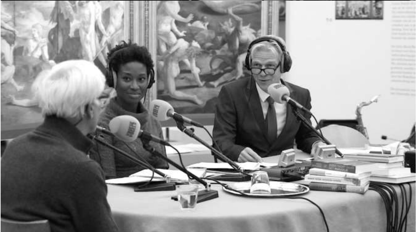
Feestelijke afsluiting met Vroege Vogels live vanuit Museum De Lakenhal.