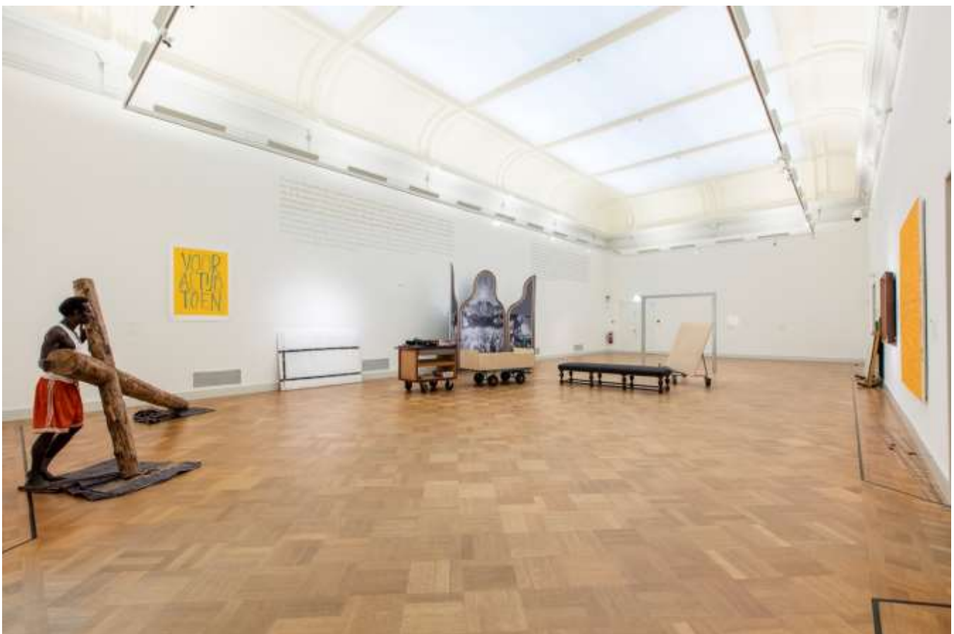
Uithuizing van de collectie.

Op 31 december 2016 had de Vriendenvereniging VBL 575 leden.