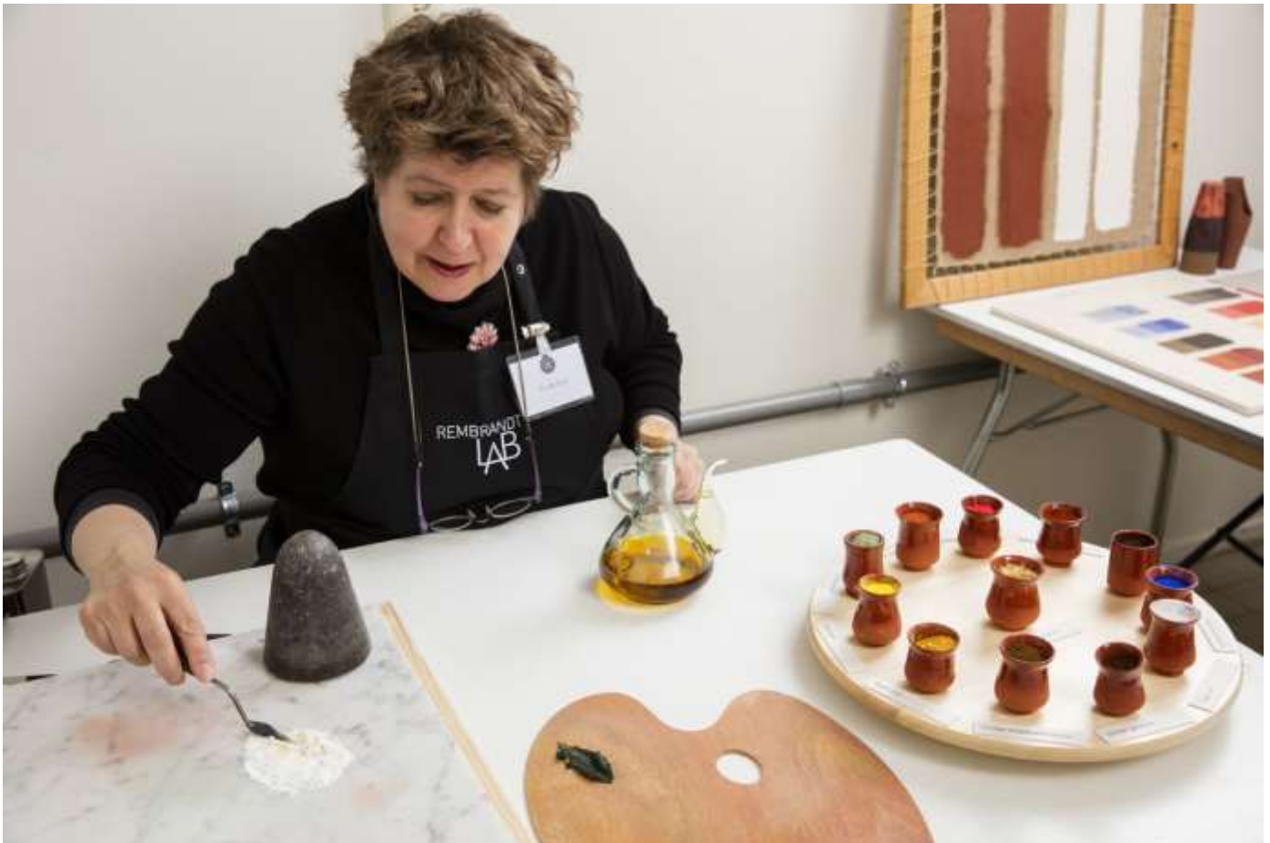
RembrandtLAB publieksprogramma

Bij het RembrandtLAB werd door Museum De Lakenhal een educatieprogramma ontwikkeld: een demonstratie verfbereiding waarbij verf werd bereid zoals dat in de 17de eeuw werd gedaan. In dit zogenoemde OpenLAB lag het accent op materiaalkennis; kleur- en pigmentgebruik en grondering. Deze doorlopende demonstraties werden gegeven van woensdag tot en met zondag van 14.00 tot 16.00 uur door de museumdocenten, die hiertoe waren geïnstrueerd door medewerkers van het Rembrandthuis in Amsterdam en Verfmolen de Kat aan de Zaanse Schans. Deelname was gratis voor individuele bezoekers en families met kinderen.